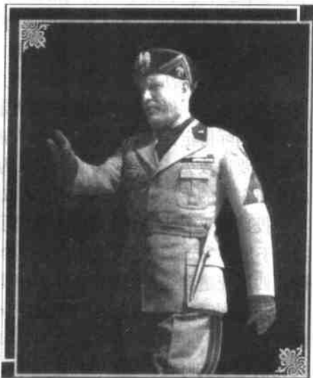
意大利的独裁统治者墨索里尼