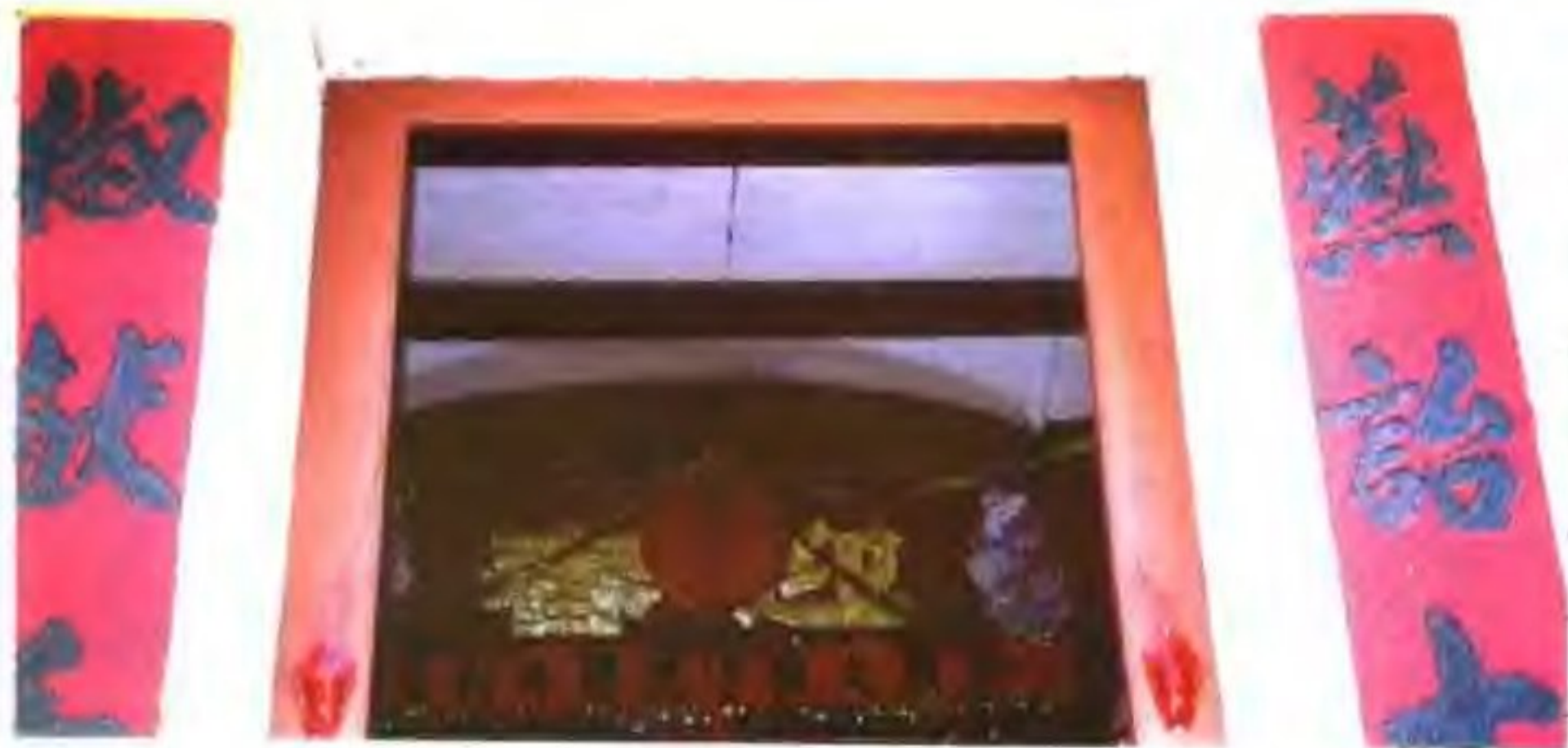
恩平歇馬村梁氏宗祠大門