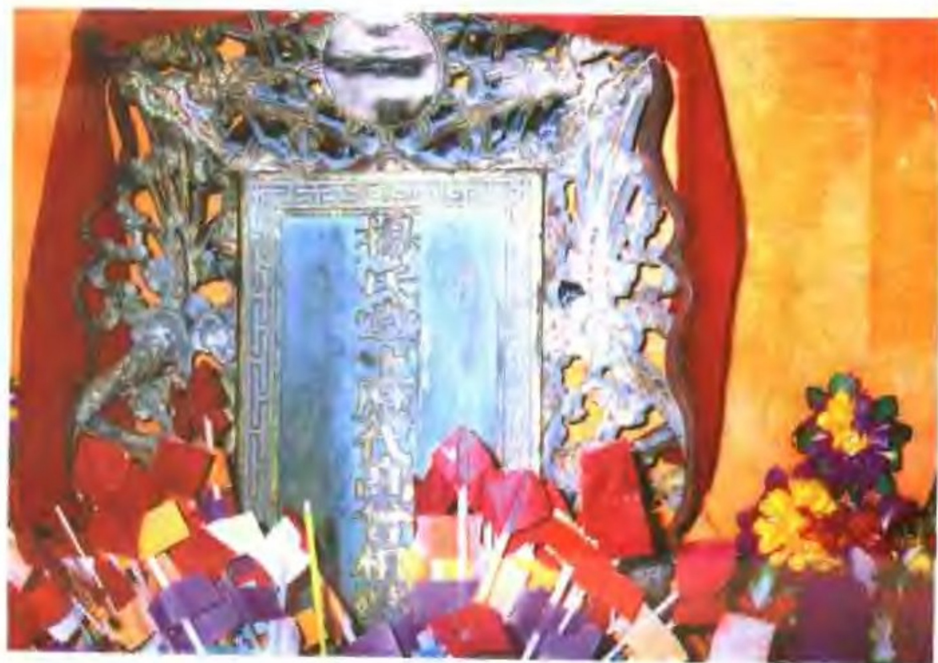
赤溪镇象岭村杨氏老屋堂屋正中摆放的祖先牌位