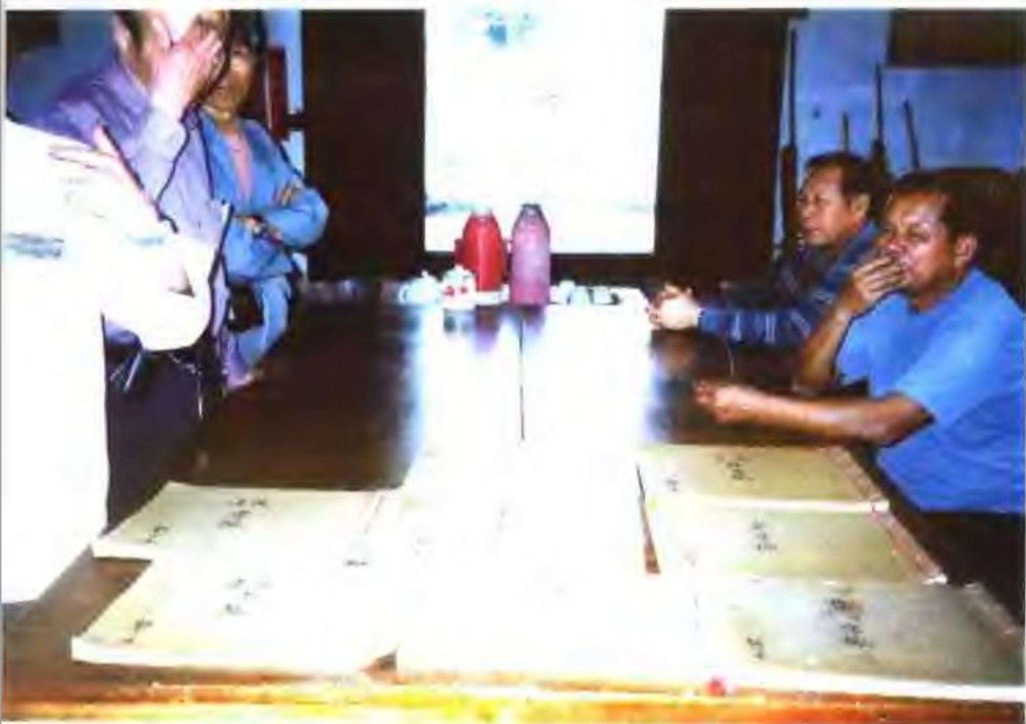
恩平歇马村《梁氏族谱》(复印件)