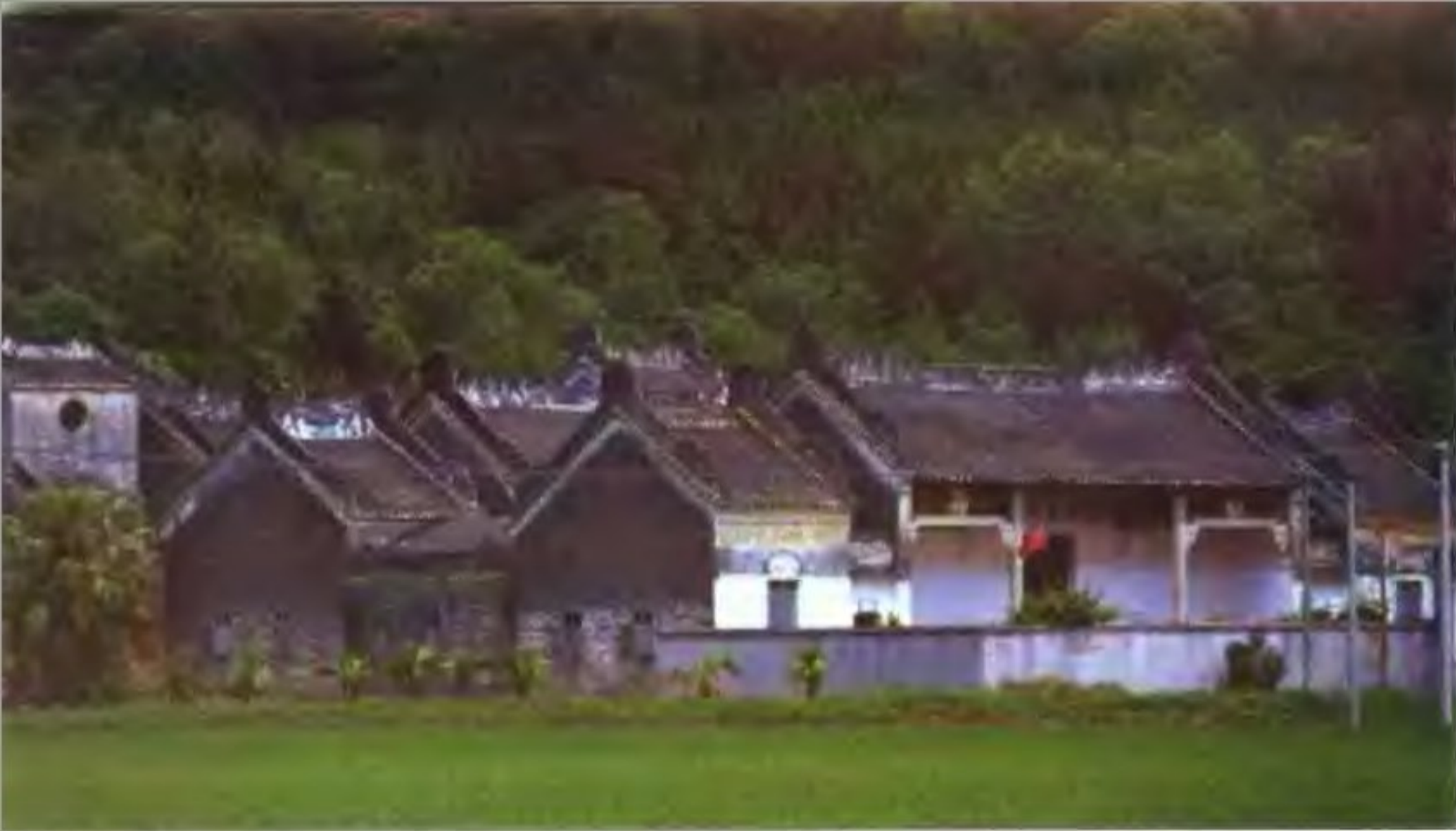
月山镇日龙村许氏宗祠

开平碉楼始于明末。“斗祸”期间及之后，开平县民纷纷出洋谋生，在国外稍有积蓄，莫不怀着恋乡情结，或汇款，或亲自回乡，买地、建房、娶妻。而清末至民国，县境尤为不靖，具有强大防御功能的碉楼大量出现，且带有世界各地的建筑文化背景。现登记在册者 1833 座。