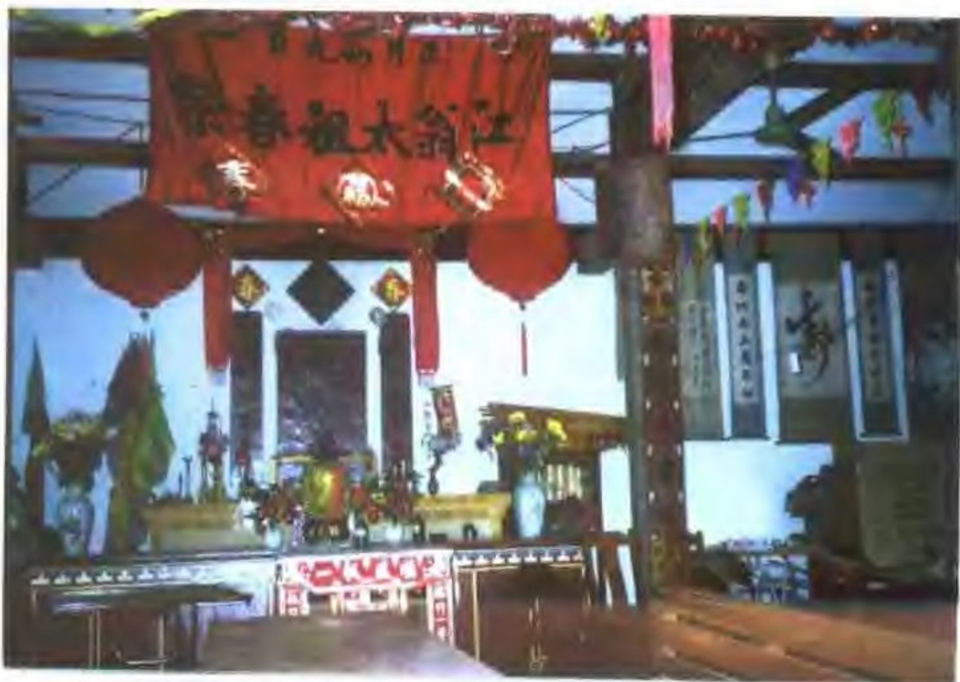
恩平歇馬村梁氏宗祠“春祭”祭台正面