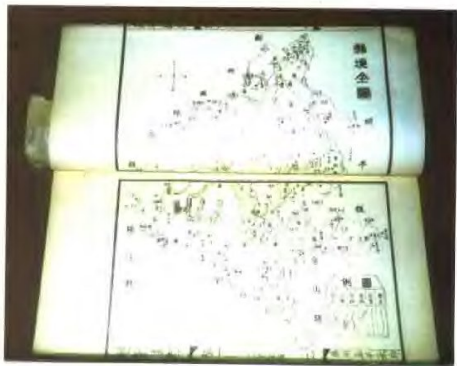
宣统《恩平县志》 所载“县境全图”