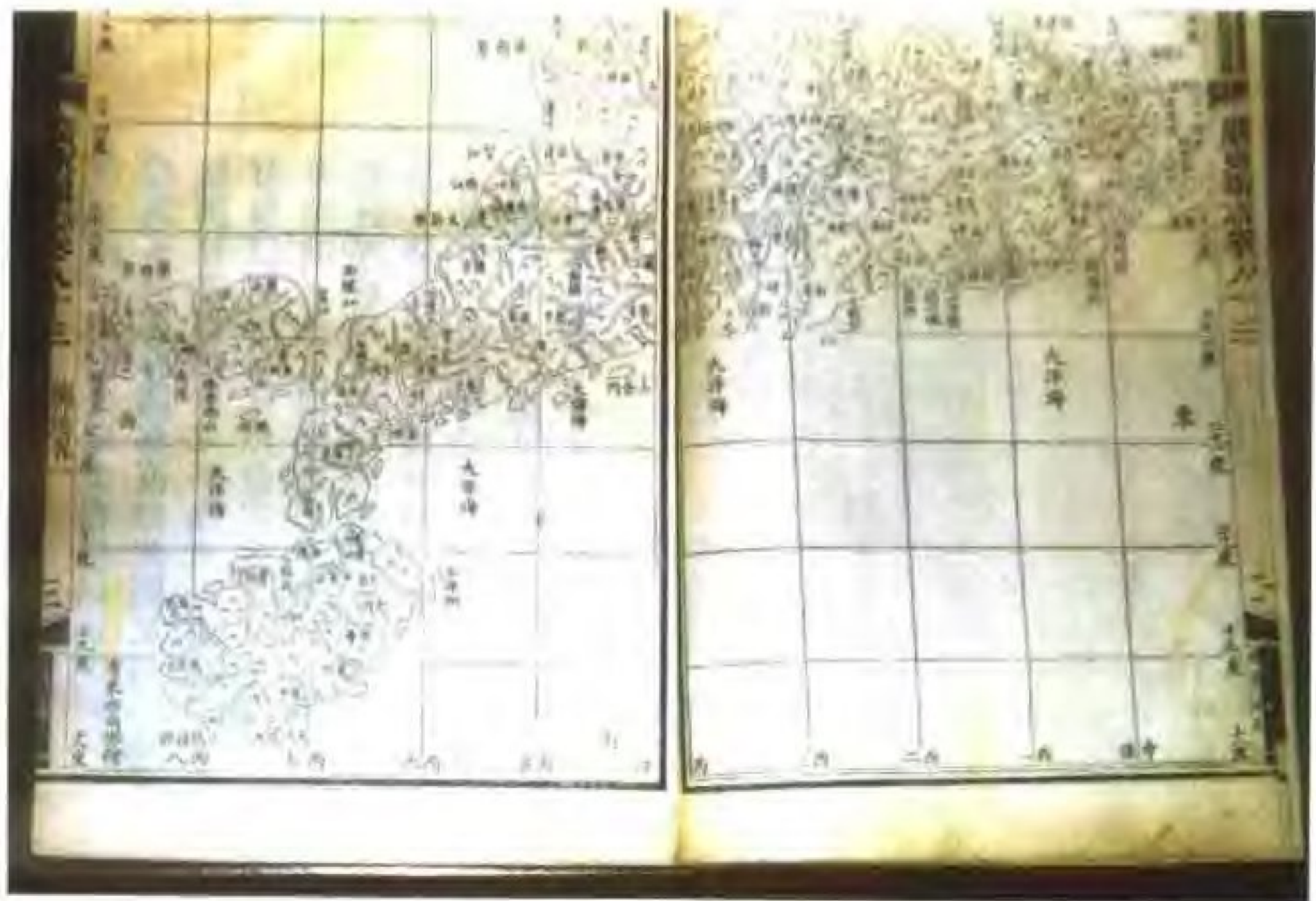
阮元《广东通志》所载“广东总图”