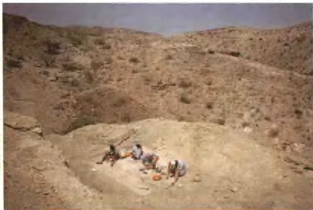
猿人遗址发掘现场