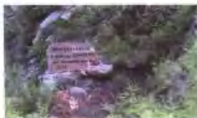
1966年北京人头盖骨发现处