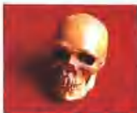
山顶洞人头骨（模型）

的时间。这一时期一般被划分为三个阶段。即旧石器时代早期、中期和晚期。大体上分别相当于人类体质进化的能人和直立人阶段、早期智人阶段、晚期智人阶段。旧石器时代的文化在世界范围内分布极为广泛。我们可以简单地将这个过程做一个阶段划分。