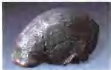
第一具北京人头盖骨化石