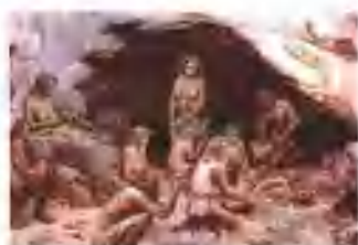
丁村人生活想象图