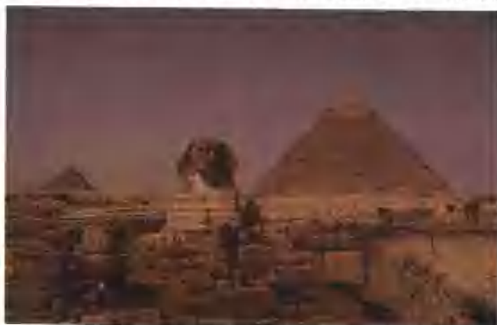
金字塔和狮身人面像

它们大小不一，分别重达1.5吨至160吨，平均重约2.5吨。据考证，为建成大金字塔，一共动用了10万人花了20年时间。第二大金字塔是古埃及第四王朝（约公元前2575—前2465年）的第四位法老海夫拉的陵墓，因此被称为海夫拉金字塔，塔高143.5米。举世闻名的狮身人面像便紧挨着海夫拉金字塔，