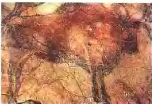
阿尔塔米拉洞穴壁画