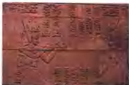
柏林埃及博物馆浅浮雕之一。图中右侧的女神，即爱与生育之神伊希斯(Isis);右侧的男子是法老。图中上部和中部布满象形文字。