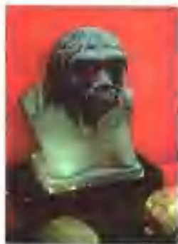
头盖骨复原后的“北京人”