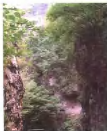
“北京猿人”遗址内景