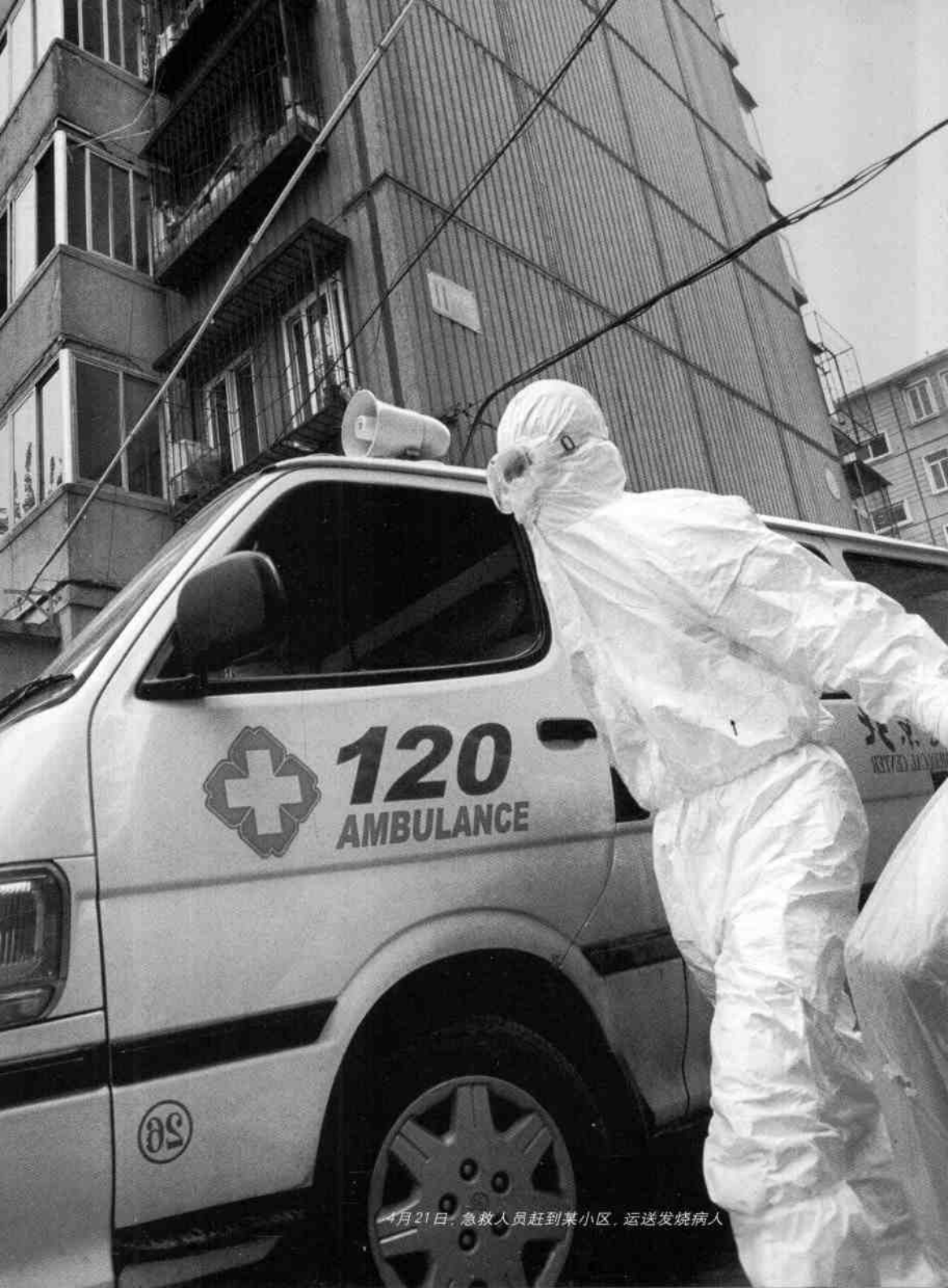
4月21日，急救人员赶到某小区，运送发烧病人