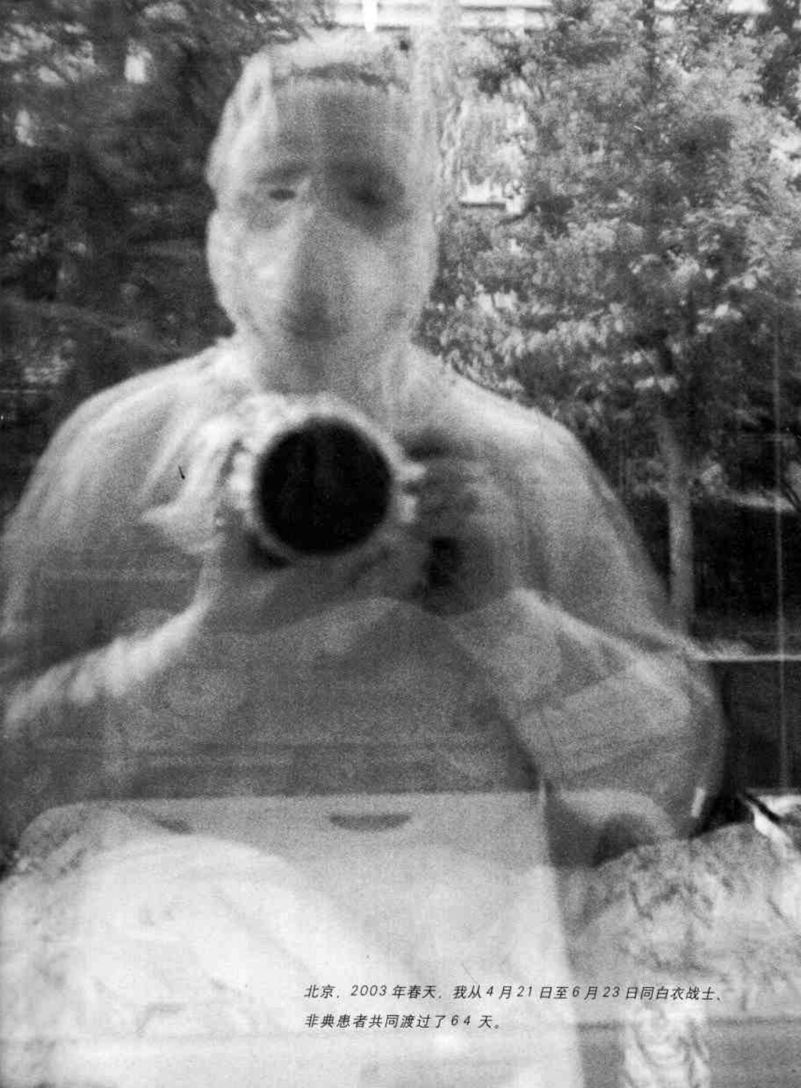
北京，2003年春天，我从4月21日至6月23日同白衣战士、非典患者共同渡过了64天。