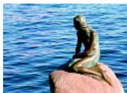
④ 美人鱼铜像坐落在朗厄里尼港湾的海滨公园,是哥本哈根的标志。

哥本哈根共有 20 多座博物馆和十多个大小不等的公园。朗厄里尼港湾的海滨公园里因有一尊美人鱼铜像而世界闻名,美人鱼完美的艺术形象和安徒生童话的魅力吸引着成千上万的游人,使它成为哥本哈根当仁不让的标志。