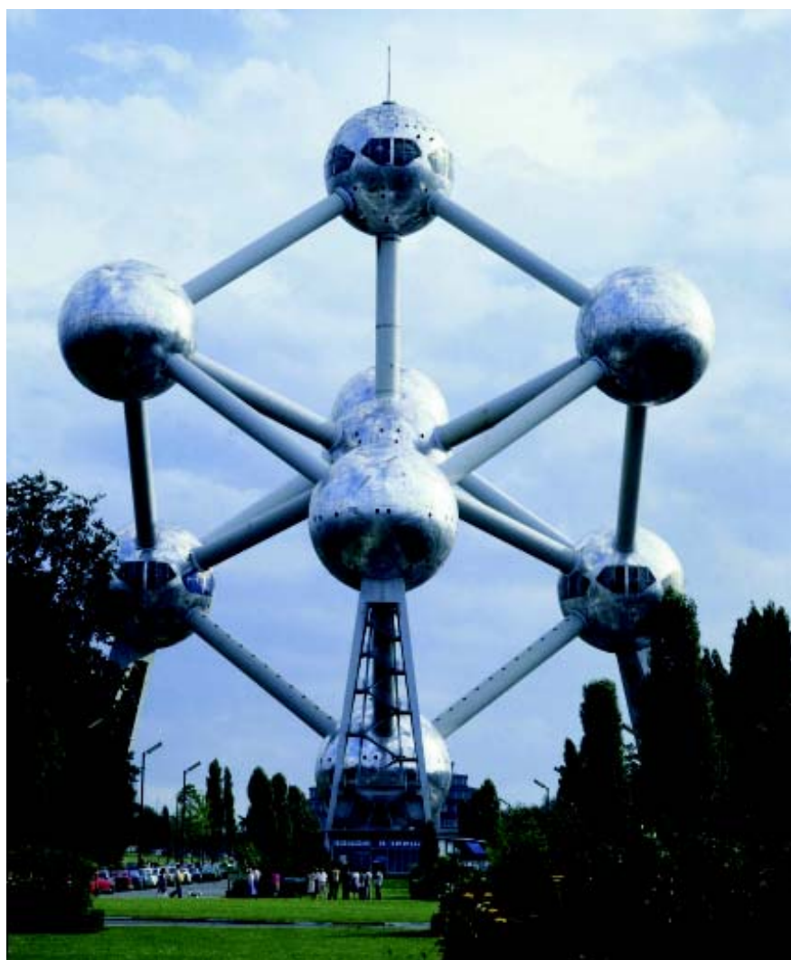
⊕ 高 102 米的原子塔本是为 1968 年的布鲁塞尔万国博览会而专门建造的应景之物，现今成为布鲁塞尔的标志之一。

布鲁塞尔欧瓦啤酒沿袭了中世纪的啤酒制法，用泉水和法国、荷兰以及德国的大麦芽历经三次发酵酿制而成。全手工制作，既不过滤也不经巴氏消毒。酒液橙黄金亮，泡沫丰富，果香浓郁。如果能配以宽嘴高级酒杯盛装，则更能品味它散发出来的草本酒花香味，欧瓦啤酒一度被世界著名品酒大师品评为全世界最特别的啤酒。