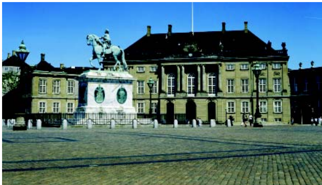
⑤ 阿马林堡宫的八角广场中央,矗立着腓特烈五世骑马铜像。

说起嘉士伯 (Carlsberg) 啤酒大家一定不会陌生,它就出自丹麦。Carls 是老板的名字,berg 是丹麦语里的啤酒。Carls 不仅制造啤酒,也深爱自己的妻子和安徒生的童话。一次机缘巧合,他想到了一个将两者完美结合的办法:依照自己妻子的容貌,提议并出资建造了美人鱼雕像。