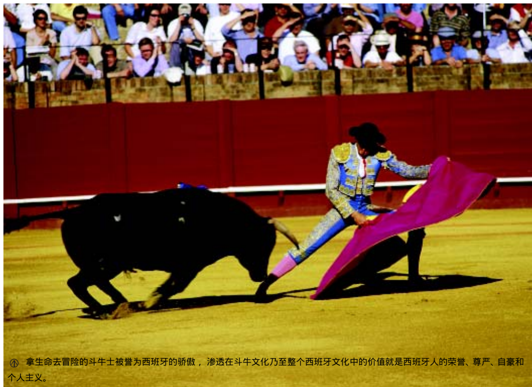
⊙ 拿生命去冒险的斗牛士被誉为西班牙的骄傲，渗透在斗牛文化乃至整个西班牙文化中的价值就是西班牙人的荣誉、尊严、自豪和个人主义。