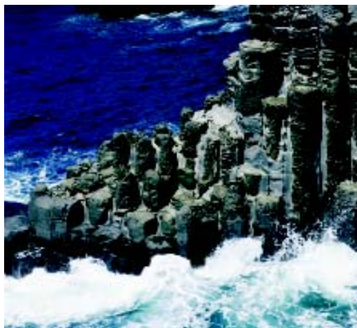
① 岛上地貌奇特，千奇百怪的岩浆凝石沿海而立。

岛上的地貌十分奇特。120万年前的火山活动成就了今天千奇百怪的岩浆凝石，韩国第一高峰汉拿山就是其间的得意之作。随着季节的变换，它的颜色和构造都发生了变化，由于景观奇特，现已辟为汉拿山自然保护区国家公园。公园内，龙头岩和龙渊是不得不说的景观。名如其形，龙头岩的顶部貌似龙头，黄昏时分定睛久视，宛若眼前盘龙虬动。龙渊位于龙头岩东侧200米处，一池碧波落于山间，静卧在岩石和树林围成的屏风中，景色令人迷醉，故而美其名曰“龙渊夜帆”。