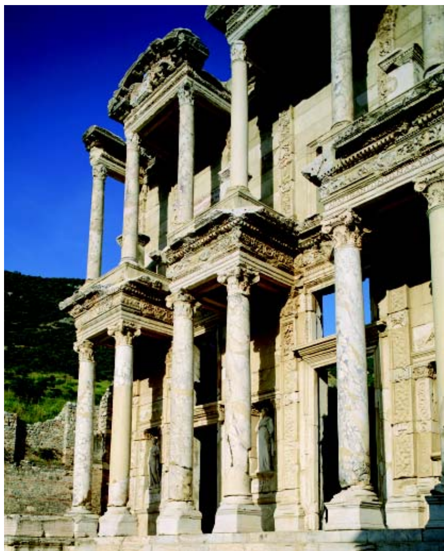
⊙ 爱琴海岸边克尔萨斯图书馆的藏书室，一座饱经风霜的文化宝藏。

纳克索斯岛是美食宝地，来去小岛都有专门的渡轮接送。该地的海滨饭店在爱琴海各小岛中数量最多，菜也最具小岛特色，所以格外受欢迎。烤肉、鱼、新鲜蔬菜、甜酒、乳酪以及用香椿叶制成的美酒都是当地人的骄傲。在这些特产中，以香椿叶为原料制成的酒最为有名。当然，对于烤章鱼脚也不要错过，这地道的当地小吃，花几欧元就能品尝到。