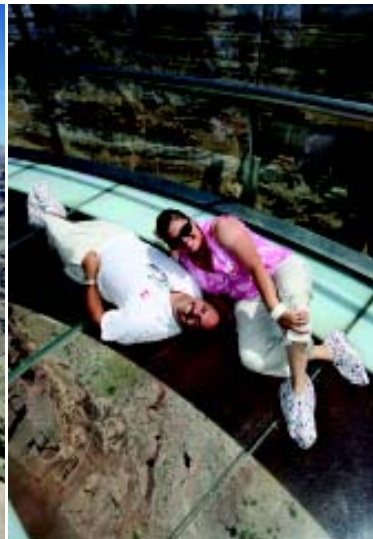
⑤ 图1：站在玻璃廊桥——“天行者”上眺望科罗拉多大峡谷。