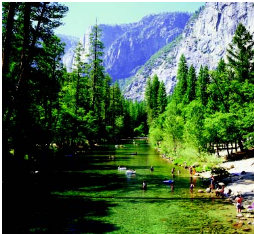
⊕ 约塞米蒂国家公园的溪流深受游客喜爱，在其中戏水也成了游客的一大乐趣。

对于世界各地的攀岩者来说，约塞米蒂国家公园是此项运动的圣地。从五六十年代开始，这里就成为美国攀岩运动的中心，当时罗亚尔·罗宾斯、伊冯·依纳德和沃伦·哈丁进行了一直被认为是不可能的第一次攀登，由此开始了约塞米蒂国家公园作为攀岩圣地的征程。约塞米蒂国家公园具备各种攀岩类型的条件：裂隙、冰穴岩壁、悬岩以及不同的攀登角度，应有尽有。其中难度最大的攀岩项目是攀登埃尔卡皮坦岩壁，它是世界上最大的花岗岩壁之一，整个攀岩过程需历时15天才能完成，具有一定的危险性。