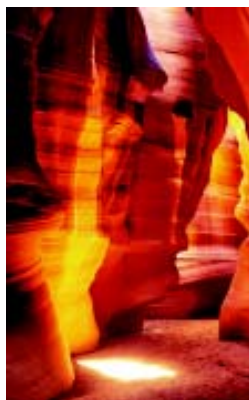
④ 大峡谷深处，流水千万年的侵蚀冲刷，最终形成了奇丽的地貌。

在遗址公园的一个山凹里，还有块著名的“报纸岩”，它也是印第安人在此居住过的见证。这上面绘满了有关印第安人的岩画，包括动物和其他各种奇异的图形。这些作品久的有几千年，时间近的最少也有几百年的历史。当昔日的主人不在，它们却依然生动地述说着数千年前的记忆，又或许，他们的主人根本就没有离开，只是已化作永世的灵魂，要长久地守护着这片地方。难怪据说是崖居人后裔的亚利桑那境内的侯瑟族人会说：“早前崖居人的灵魂仍然在遗址居住。”所以每年他们都要来此祭拜祖先。