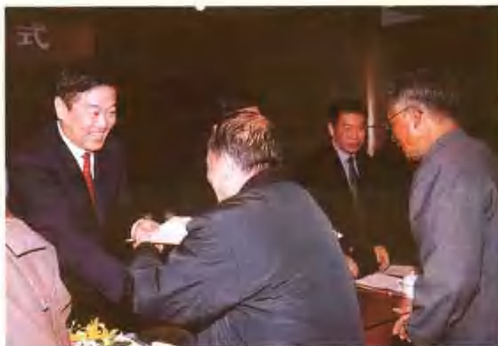
张昌平市长为老同志颁发荣誉证书