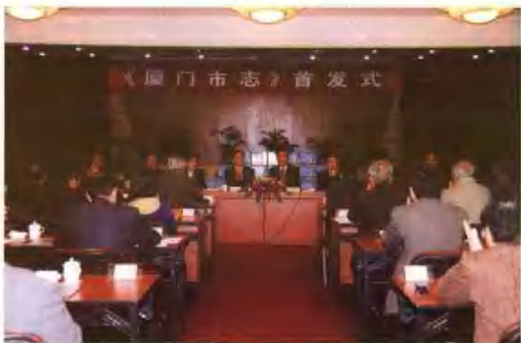
2005年1月14日，市政府在厦门宾馆明宵厅举行《厦门市志》首发式。