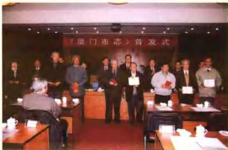
为市志编纂做出贡献的老同志受到表彰