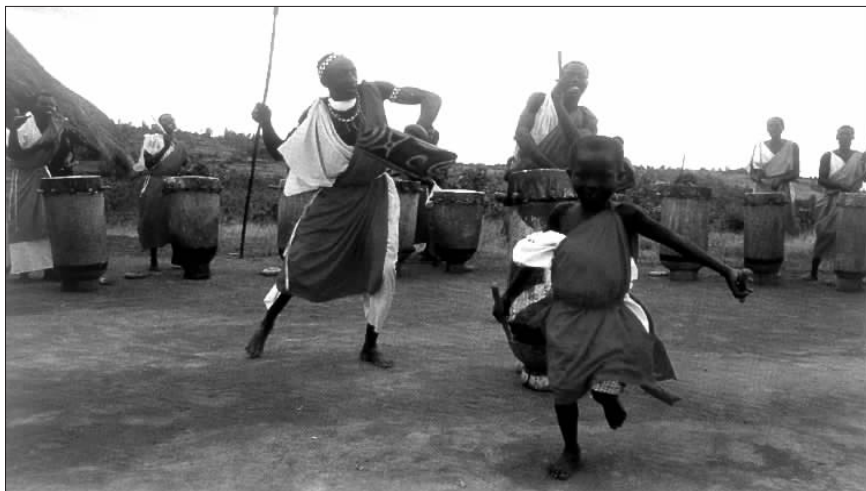
南非土著居民在欢度节日。

巴特尔·弗里尔野心勃勃，他想征服整个非洲南部，而开芝瓦约那支强大军队的存在就是对南非各族人民的最大鼓舞，因此他视开芝瓦约为眼中钉。在占领德兰士瓦后，弗里尔开始准备对祖鲁人的斗争。