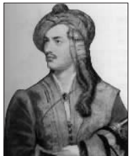
英国浪漫主义诗人乔治·拜伦也参加了希腊独立战争。

3个月后，起义军席卷了整个希腊的大部分陆地和爱琴海的许多岛屿，成千上万的人民揭竿而起，农民用木棍和镰刀做武器，纷纷加入从山上下来的游击队，他们摧毁了土耳其地主的庄园，杀死了土耳其的政权人物。4月7日，斯佩采岛宣布起义，派出11艘武装船只支援伯罗奔尼撒的起义。4月22日，普萨拉也宣布起义。4月28日，伊德拉岛起义军民派出战船控制科林斯地峡。5月7日，阿堤卡地区的武装村民冲进了雅典，迫使土军退守卫城。6月，依普希兰狄斯率领在摩尔达维亚和瓦拉几亚组建的起义军进入希腊支援起义时，在德拉戈尚与土军交战，被土军打败，依普希兰狄斯逃往奥地利，不久被捕。