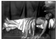
英国诗人拜伦为希腊自由而战，并献出了自己年轻的生命。