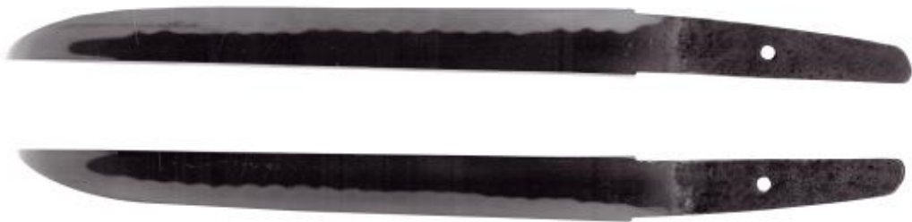
▲短刀，关美浓派先行者兼光作，长 24.8 厘米，此刀作于南北朝永德年间（1381 年前后）。

日本现存平安时期的刀剑绝大多数为太刀，短刀并不多见，胁差（中刀）则完全没有。这时的太刀与我们现在所见的日本刀已没有太大的差别了，即尖端宽度大约是柄部的一半，宽窄比例悬殊，腰反弧度较大，小帽子，多为直刃。但当时乱刃系列技术尚未成熟，刀柄中心细且弯，中心形状多数呈雉子股。现存源平战争时平家所持的“小乌丸”及“毛拔形太刀”为典型代表作，“村正”则是当时的一代名刀匠。