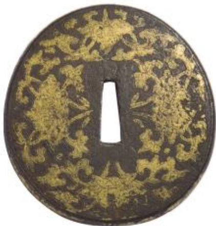
▲中国明代初期错金花草纹刀镡，高7.5厘米，外围造型似鸡卵形。