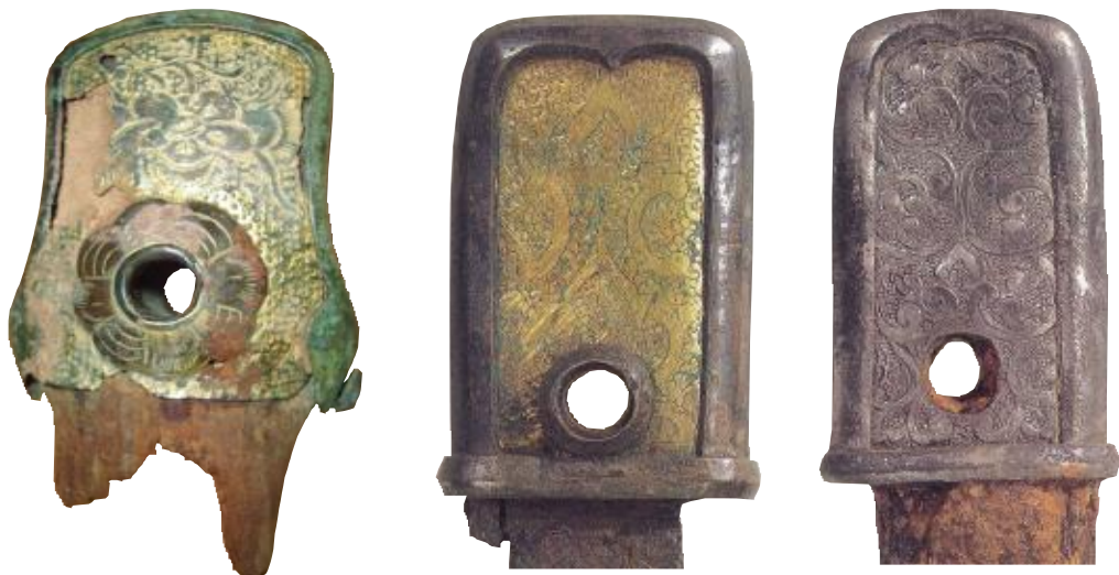
▲左图为我国隋唐时期的剑首，采用银刻花鎏金，边际青铜裹覆，握柄梨木仍在。 右边两图取材自东京国立博物馆，为当时的日本藏品，可见与中国的产品极为类似。

事实上，日本刀最早仿自我国西汉的环首直刀，至唐朝时期改为模仿“唐大刀”，其后以“唐大刀”为基本蓝图，对刀的冶炼方法、淬火技术、造型变化等逐步加以改进，至日本镰仓时代初期（12世纪左右，相当于我国的宋朝时期），日本刀的制作已脱胎于我国刀剑而自成一格。并且日本对历代刀工的名录以及各系刀的锻造方法均做了极系统的整理，形成系谱，精确且便于查阅。