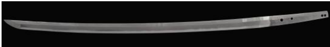
▲古刀期关派代表性刀匠兼元所作的刀，刃长 68 厘米，刀茎上有 4 个目钉孔。作品完成时长约 76 厘米，后将刀茎处改短约 8 厘米。