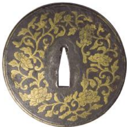
▲日本室町时代圆形刀镡，高8厘米，整体造型与下图中国镡的纹案做工类似，只是刀茎孔边缘及镡边缘加有银线。由这两个刀镡可看出，我国明初时期中日两国刀文化交流甚深。

到了我国明朝时期，日本的炼刀技术已超越了我国。明朝末年，日本不断侵扰我国东南沿海地区，明朝朝廷命戚继光率领大军对倭寇进行围剿。其实当时的日本侵略者并非政府军队，而是一群流浪的海盗，每次侵犯我国沿海的人数并不多，少则数十人，多则近千人，但当时自身难保的明朝朝廷已穷于应付。后来，戚继光发现日本使用的兵器较明军的优良，于是向日本购买了一批兵器，以其人之“刀”还治其人之身。连戚将军本人所用的持刀也改成类似日本刀造型的单手刀，后世称为“戚家刀”，并且创造了专门克制日本刀的“鸳鸯阵”，如此才得以对抗长年边患。