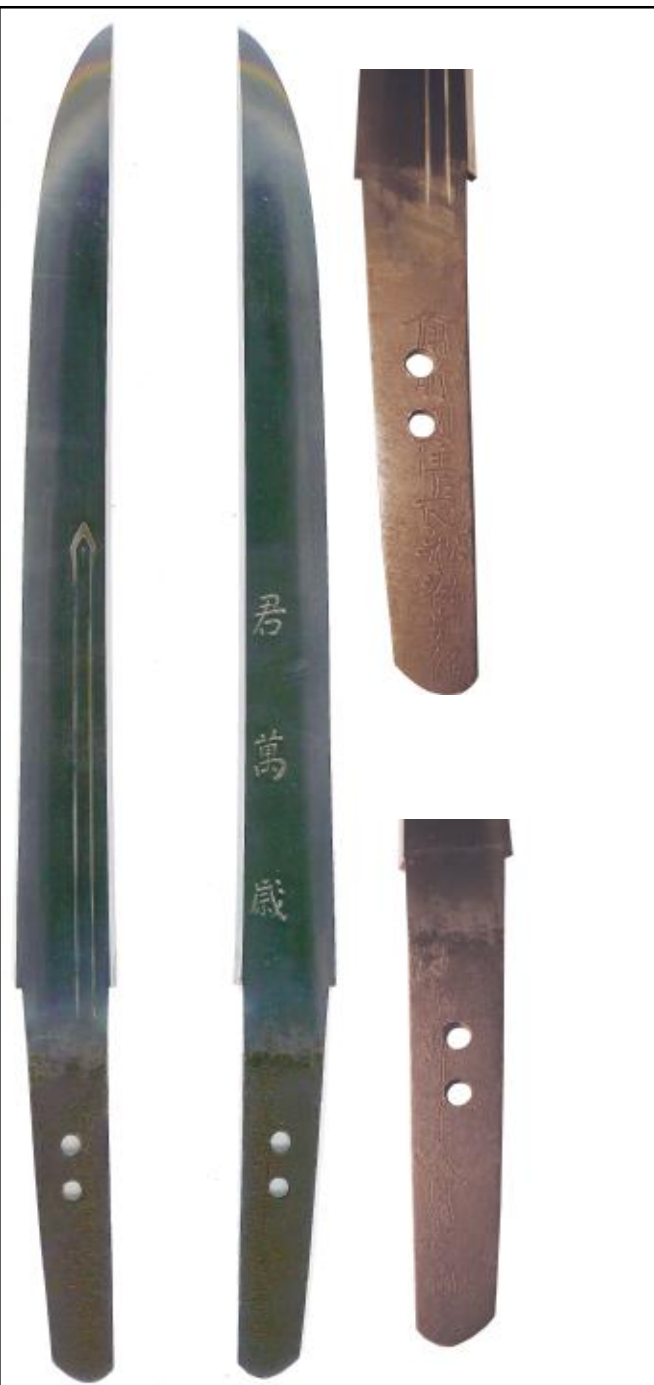
▲短刀，长 25.7 厘米。款，（右上）备前国住长船祐定作；（右下）永禄十一年八月吉日。

此刀作于 1568 年，今冈山地区名派所作，表面雕素剑，里面雕“君万岁”，长度标准，应属高级武士所持。