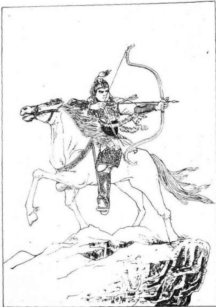
图 4 中国历史上第一次军服改革——胡服骑射

时间赵国北驱匈奴，西抗强秦，东伐燕、齐，成了战国七雄中的强国之一。这次服装改变，使军服成为一个独立的概念出现于军队装备之中。