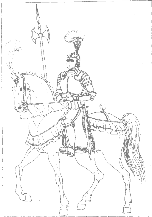
图 5 欧洲中世纪的骑兵铠甲