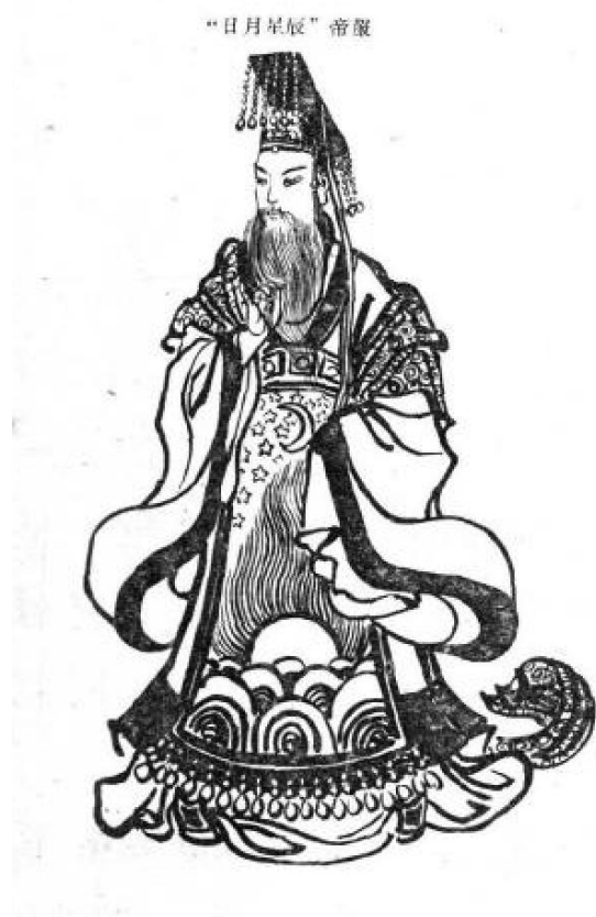
图2 古代帝王的帝服

根据等级的不同及所担负职务的差别，服装绘有各种不同的图案。帝服上画有日、月、星辰，表示其主宰整个世界；而大臣们则根据分管任务的不同，分别画有虎、凤、水、米、牛、羊、刀等等。从此，打破了过去那种天下同服的局面。