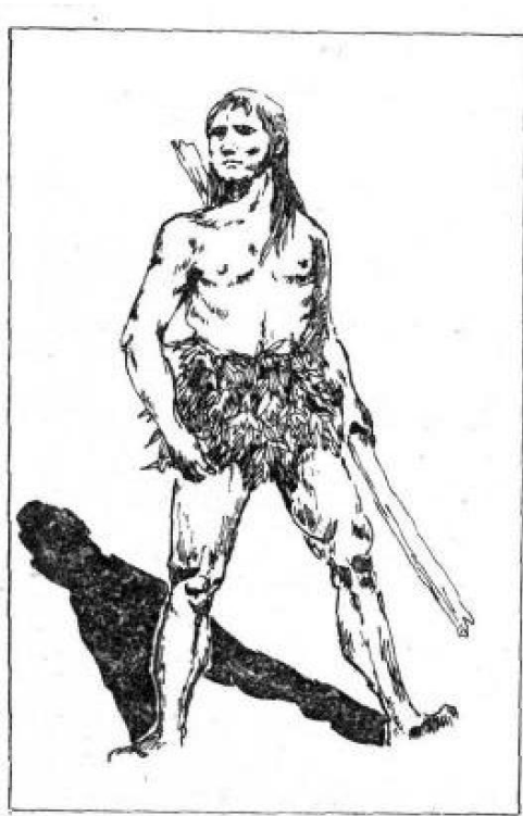
图 1 原始社会的“衣服”

祖先从赤身裸体地生活到开始穿上树叶、兽皮类的简单服装，至今却仅仅只有六千年的历史。值得骄傲的是，我们中华民族是世界上最早穿上衣服的民族之一。