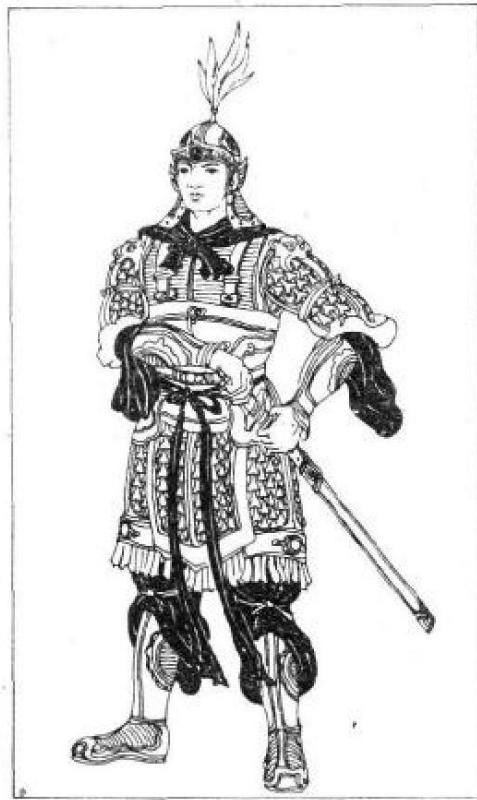
图 6 中国古代的铠甲

盔甲也逐渐走向消亡，而代之以新的军服式样。今天，我们从戏剧舞台上看到的盔甲式样，一般多是明代的。