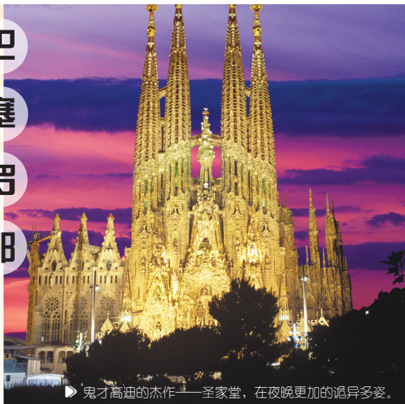
▶ 鬼才高迪的杰作——圣家堂，在夜晚更加的诡异多姿。