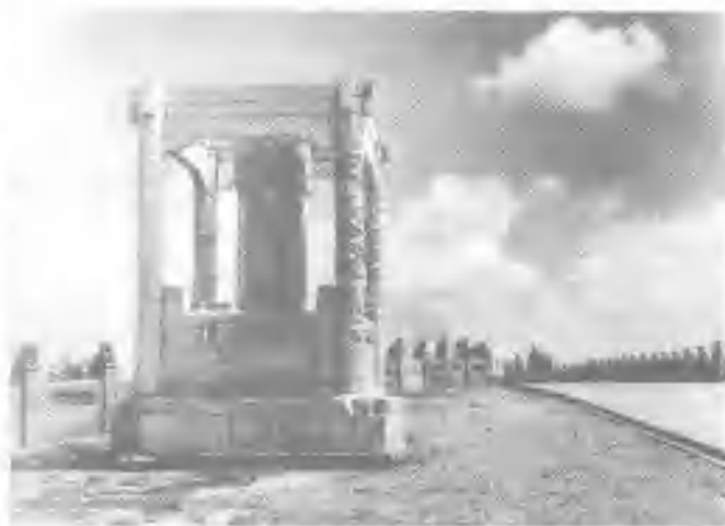
1937 年 7 月 7 日夜,日本在北平(今北京)丰台的驻屯军以军事演习为名向驻守卢沟桥的中国守军发动突然进攻。图为七七事变要地卢沟桥。

至 1937 年 7 月上旬,日本帝国主义发动全面侵华战争时,日中双方总的实力对比是敌强我弱,正如毛泽东所指出的:日本“是一个强的帝国主义国家,它的军力、经济力和政治组织力在东方是一等的,在世界也是五六个著名帝国主义国家中的一个”。中国则