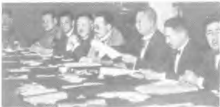
图为1927年6月27日至7月7日的“东方会议”。右起第三人为田中义一。

1927年6月27日至7月7日,日本首相兼外相田中义一主持内阁召开了以研究对华政策为中心的东方会议,提出了对华政策纲领,并在会后写成了臭名昭著的《田中奏折》,宣称:“欲征服中国,必先征服满蒙,欲征服世界,必先征服中国”,进而指出“第一期征服台湾,第二期征服朝鲜,皆已实现,惟第三期征服满蒙以及征服中国全土,——则尚未完成。”(《简明日本近代史》,第269页,天津人民出版社1987年版。)从而,使“大陆政策”变为具体的战略计划和对外扩张的实际步骤。