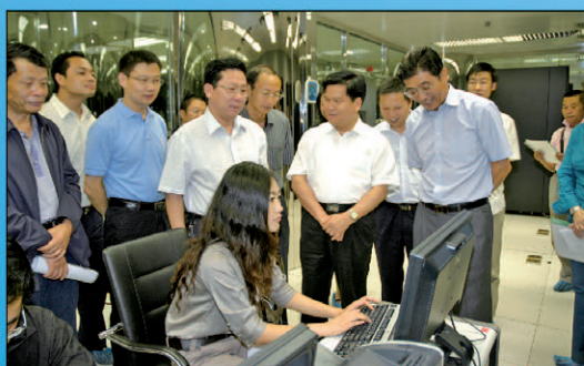
8月11日云南省委副书记李纪恒到人行昆明中支调研