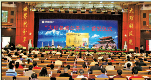
“大理名城财政预算单位公务卡”在云南首发

积极履行社会责任,“成长计划”、“英模母亲”慰问等活动得到社会好评。被省政府评为“云南省2008年度兴边富民工程先进单位”,在“2009云南金融百姓口碑榜”评选中获“昆滇百姓好口碑大奖”。