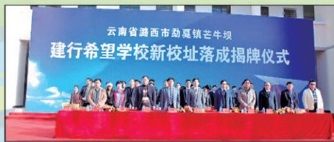
2009 年 12 月 19 日,出资援建的“建行希望学校”在云南省泸西市勐戛镇芒牛坝落成揭牌