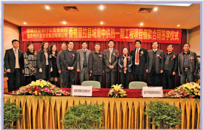
支持迪庆藏区发展