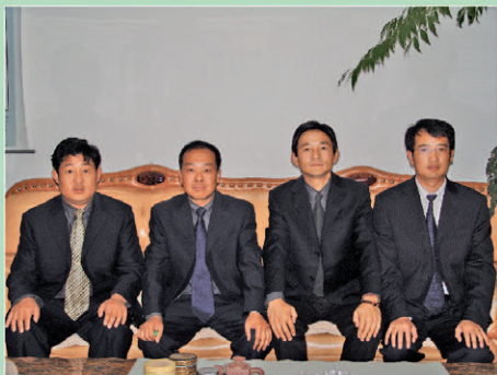
团结奋进的领导班子