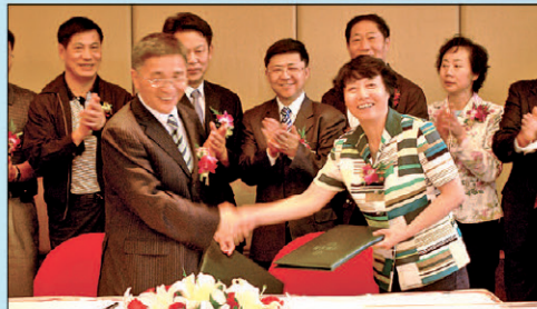
与省财政厅在昆明签署德国政府贷款云南省昆明市经济技术开发区污水处理与再生利用项目转贷协议