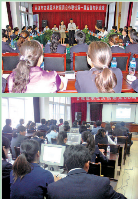
积极开展业务知识竞赛