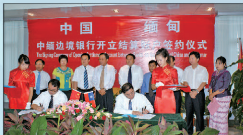
与缅甸经济银行代表成功签订《人民币清算协议》,正式与缅甸经济银行建立了合作关系