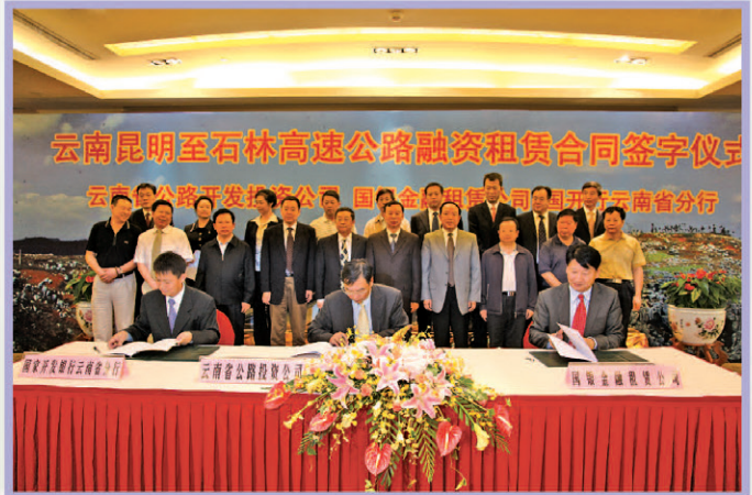
签订昆石路融资租赁合同

展望未来,云南分行全体员工将秉承服务、竞争、务实、创新的宗旨,以客户为中心,增强服务能力建设,提升自身实力和竞争力,在彩云之南这片神奇而美丽的热土上,用智慧和勤劳再创新的业绩,为云南省经济社会发展做出新的贡献!