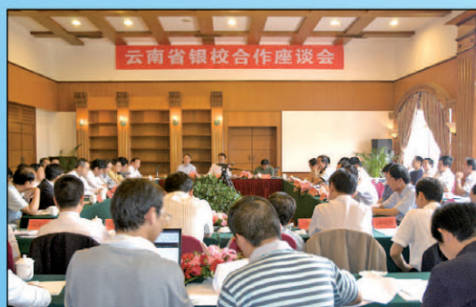
6月29日云南省银校合作座谈会在滇池花园酒店举行