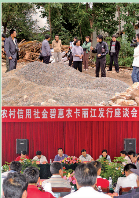
大力支持「三农」经济发展