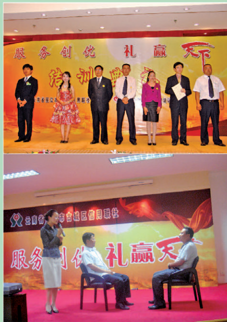
不断提升优质服务

三是全面落实实施服务创优工程工作。为贯彻落实《中国银行业文明服务公约》,根据云南省农村信用社联合社的安排部署,从年初开始,全社在辖区范围内全面落实实施服务创优工程工作,并在工作中坚持“规定动作不走样,自选动作有特点”的原则,制定了《丽江市古城区农村信用联社服务创优工程实施方案》,明确了各部门岗位的职责,将创优服务活动的各项指标任务细化落实到业务部门和一线工作人员,确保了这一工作到年末取得非常好的效果。由于全社开展实施服务创优工程工作的出色,所辖的古城区联社营业部被丽江市总工会推荐参与全省“工人先锋号”评选活动,并成为全市银行系统唯一一家被推荐的单位。