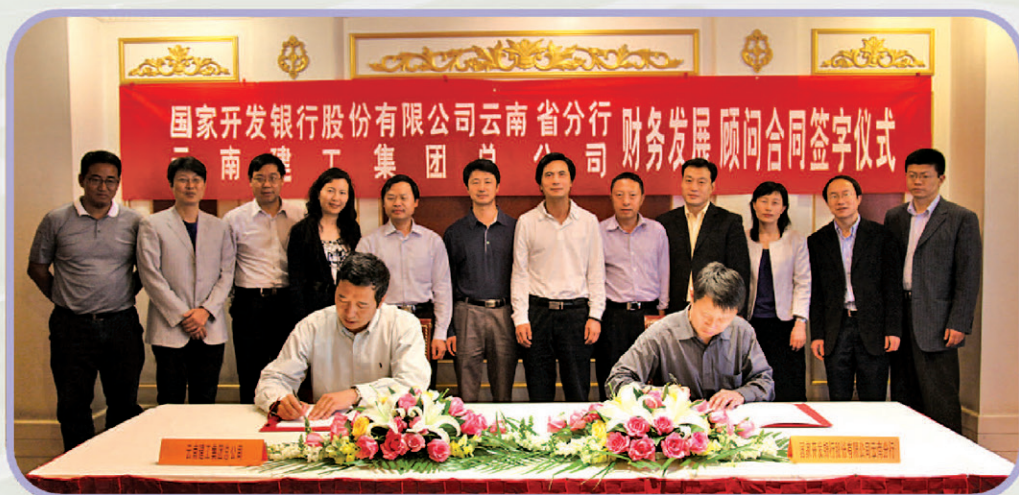
与云南建工签订财务顾问协议

国家开发银行云南省分行组建于1999年12月。10年来,伴随着云南经济的跨越式发展,分行在总行党委的正确领导下,在云南省委省政府的关心支持和有关监管部门的指导帮助下,以高度的使命感和责任感将自身完全融入云岭大地的血脉中,不断探索和深化开发性金融实践,累计发放贷款超过2600亿元,信贷资产余额超过千亿元,从支持国家重