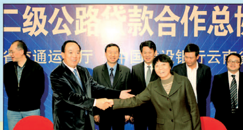
与省交通运输厅签订云南省在建二级公路贷款合作总协议,124.5 亿元贷款支持我省 52 条在建二级公路建设