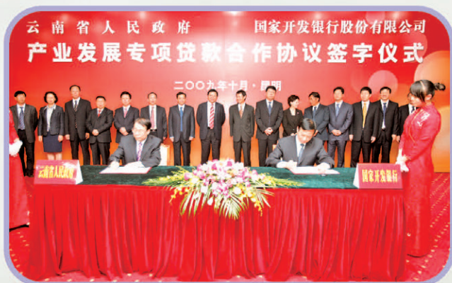
与省政府签订产业发展专项贷款合作协议

国家开发银行云南省分行组建于1999年12月。10年来,伴随着云南经济的跨越式发展,分行在总行党委的正确领导下,在云南省委省政府的关心支持和有关监管部门的指导帮助下,以高度的使命感和责任感将自身完全融入云岭大地的血脉中,不断探索和深化开发性金融实践,累计发放贷款超过2600亿元,信贷资产余额超过千亿元,从支持国家重