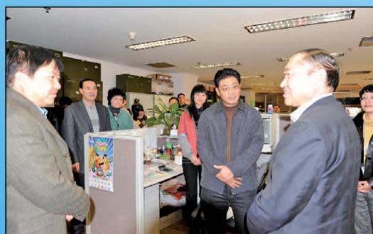
12月31日云南省常务副省长罗正富到人行昆明中支慰问奋战在年终决算一线的国库职工