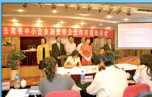
5月9日云南省中小企业融资银企合作对接洽谈会在经贸宾馆举行