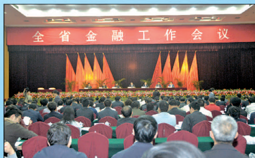
3月24日全省金融工作会议在连云宾馆举行