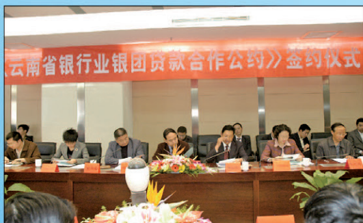
3月13日云南省银行业银团贷款合作公约签约仪式在人行昆明中支3楼会议室举行