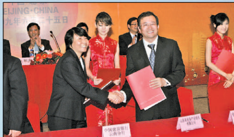
“云南省城市污水处理设施 200 亿元银团贷款项目”在京签署协议