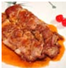
红梅香草汁伴香煎鹅扒