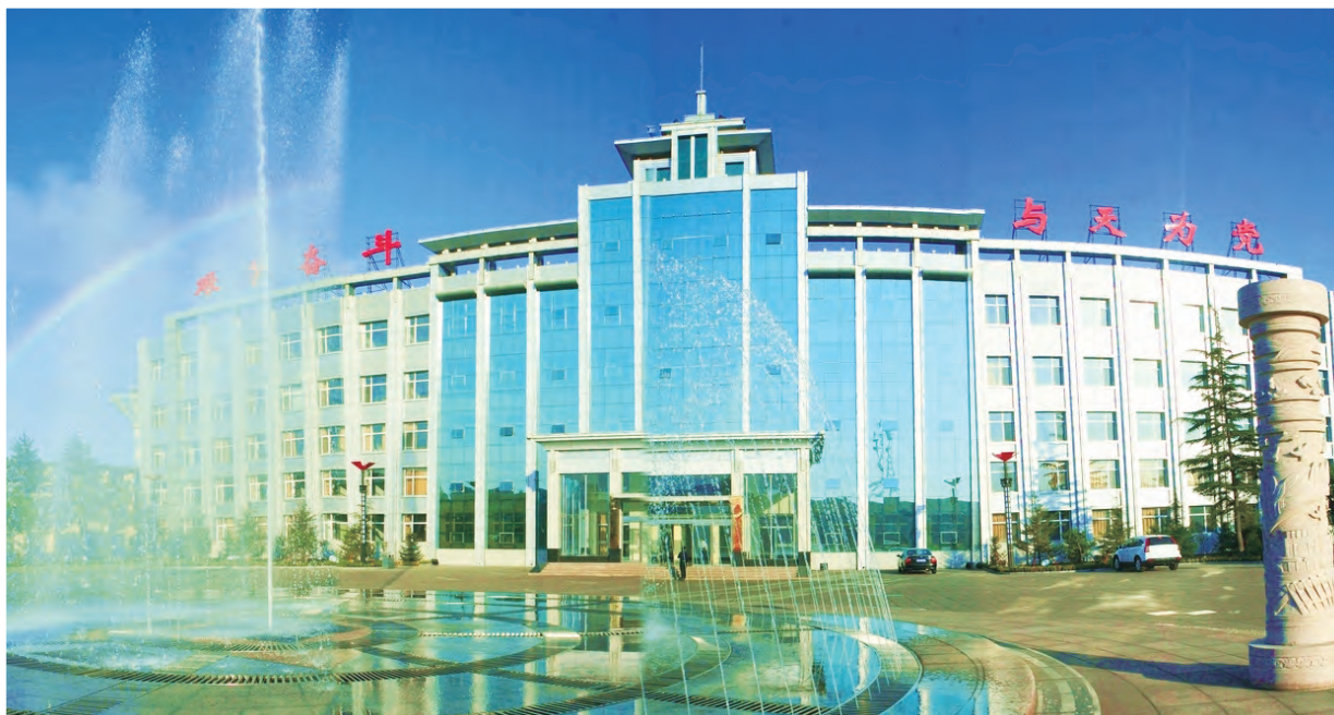
五阳煤矿办公楼全景