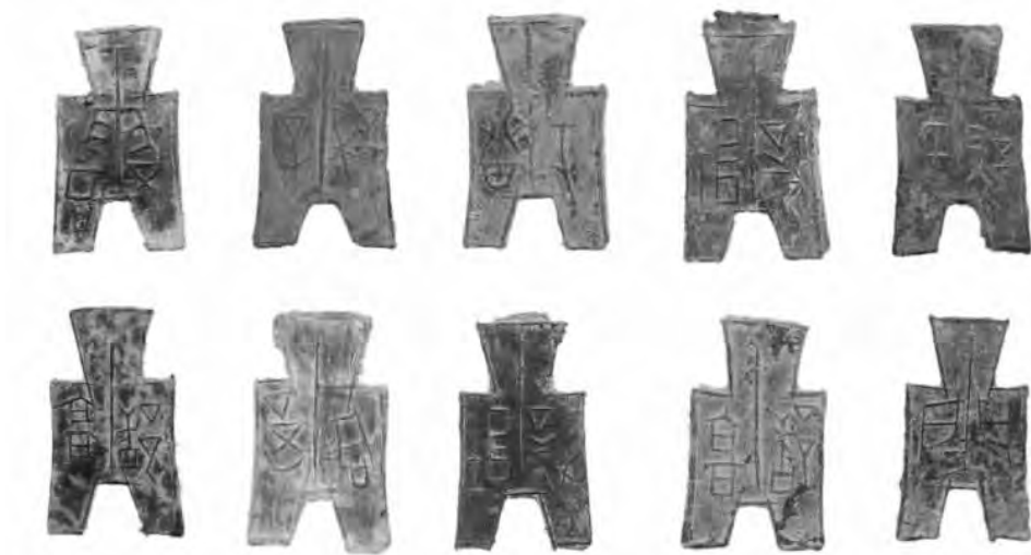
春秋战国时铸造有上党古邑地名“潞、长子、襄垣、铜鞮、高都、涅、屯留、端氏”的方足布币

1939年7月，日军再次占领上党重镇长治城，一直到1945年六年时间里，日军利用长治四周城墙陆续修建军事堡垒四十多处，“长子楼”、“八义