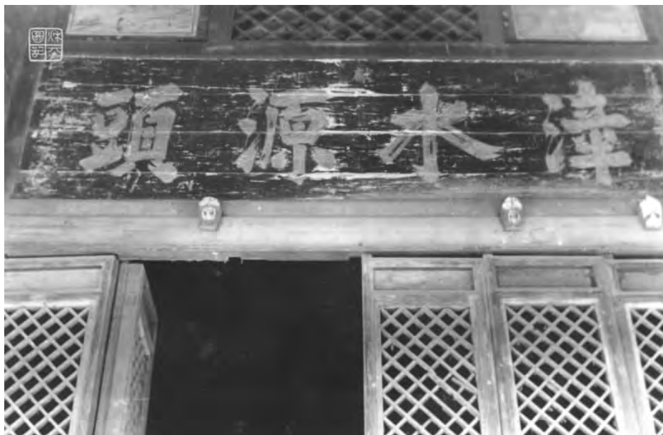
位于沁县漳源镇的漳河庙匾额

上党是水带来的生命、水带来的城市,远古的人类依水而生、依水而居、依水繁衍。秦始皇统一六国,上党为其 36 郡之一,由此,美丽的水带来魅力的城市,浑厚的水造就富足的潞州。难怪乎荀子感叹道“上党从来天下脊”,更难怪乎明万历朝工部左侍郎沈思孝挥毫疾书,在他的《晋录》中发出“潞、泽豪商甲天下,非数十万不称富”之感叹。