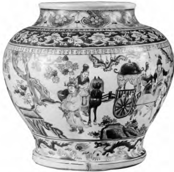
明代潞商烧制的红绿彩将军罐