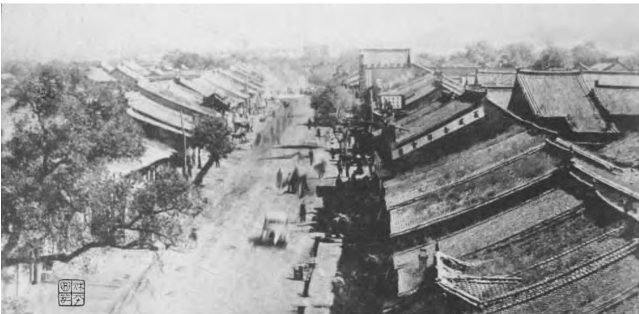
上世纪初潞安老城街景

荣形成“城市”的写照。同时期的上党,也有了比“市”大得多、而且规模很像样的城市,潞子婴儿国的“潞城”、赵襄子的封地“襄垣”、尧封长子之地的“长子”,还有赤狄留吁居住屯兵留粮之地的“屯留”,以及“高都、涅、泫”等等“城”和“市”都已出现。而且,这些城市中繁盛的商品经济孕育出了为满足商业贸易发展的“等价物”货币。“潞、长子、襄垣、屯留、高都、涅、泫”等等大批量铸造有“城市”地名的青铜方足布币流通于“市”之间。各城市自己的货币