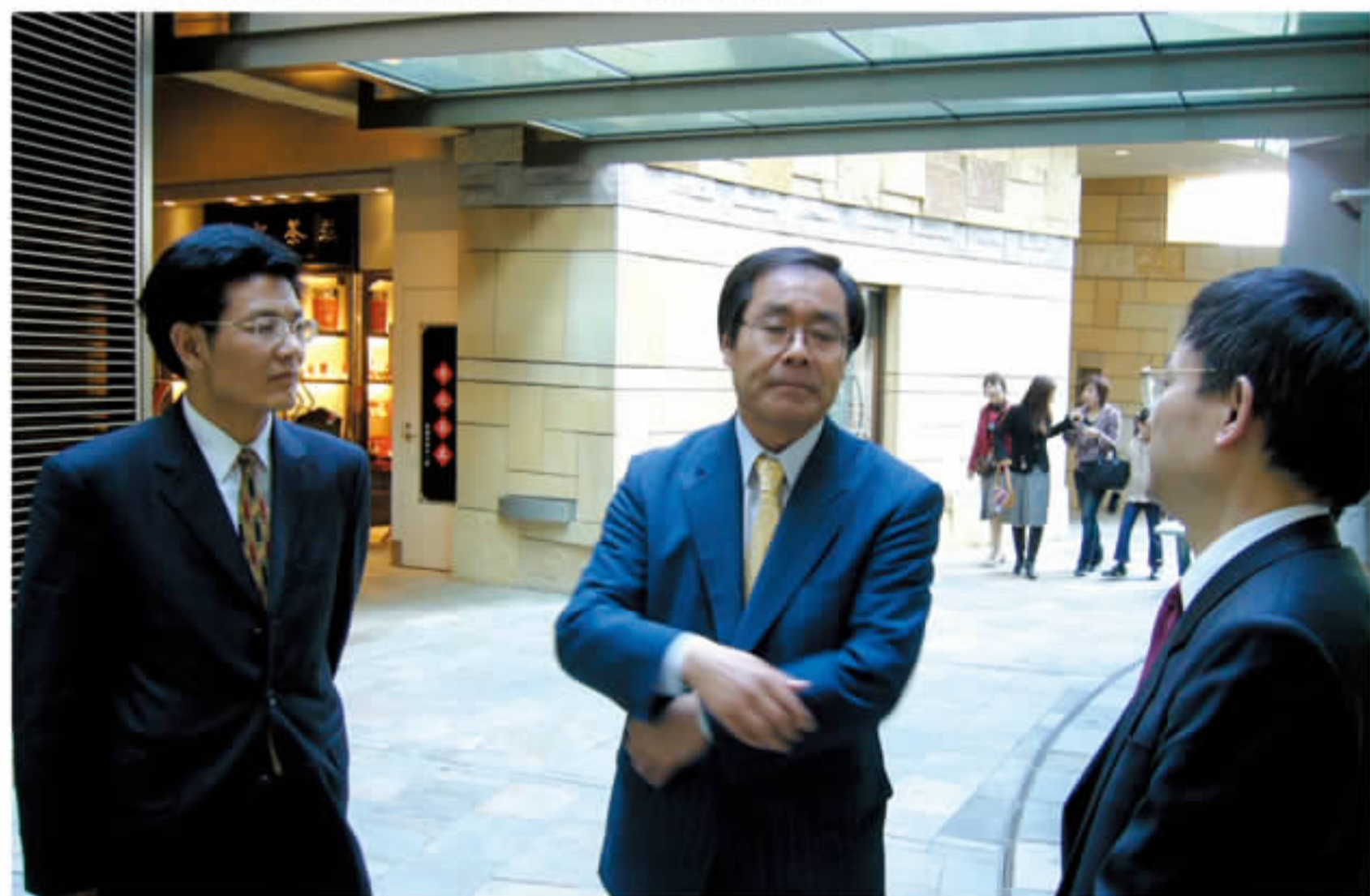
日本外务省日中经济关系室松本盛雄室长积极推动在新的历史时期日本企业与中国企业的合作与发展。图为松本先生与访日考察团成员交谈。