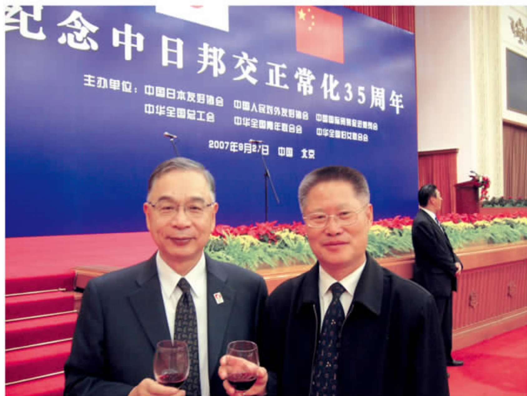
日本驻华大使宫本雄二先生长期关注中日企业间的合作，积极支持商务部研究院跨国公司研究中心从事的日资企业与中国可持续发展研究。图为宫本大使与王志乐主编的合影。