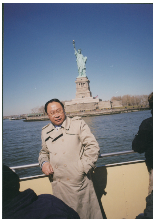
◎在纽约哈德逊河上（2000年3月）