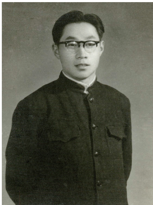
◎大学时代（1967年12月 沈阳）