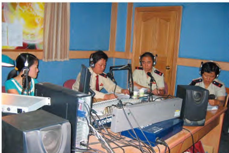
丽江市地税局利用“政风行风热线”平台开展税收宣传