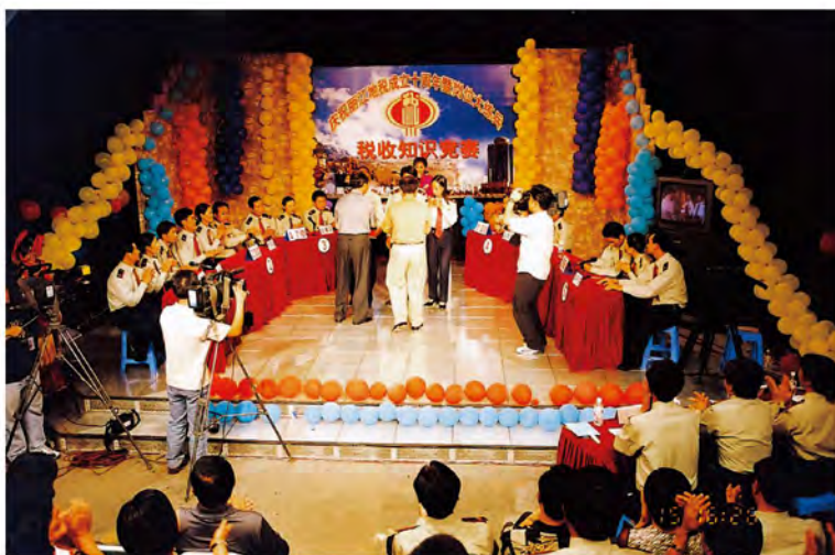
市地税局与市电视台联合举办“税收知识电视竞赛”