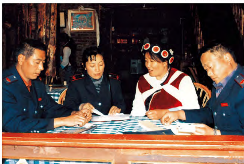
古城区地税局干部深 入古城经营户开展纳税检 查