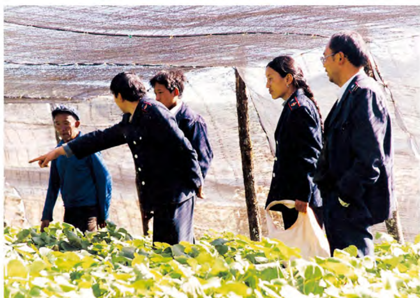
丽江县地税局干部到 龙山乡山箭菜基地了解生 产情况