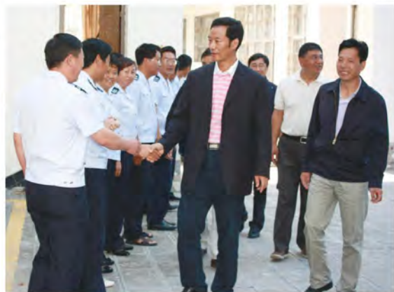
省地税局局长陈建国（左二）到丽江市地税局视察