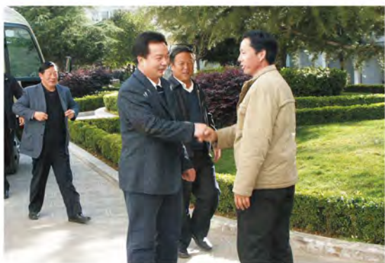
中共丽江市委书记王君正（右二）到丽江市地税局视察