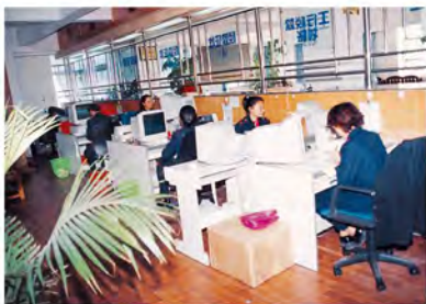
丽江县地方税务局应用微机办理税款征收业务