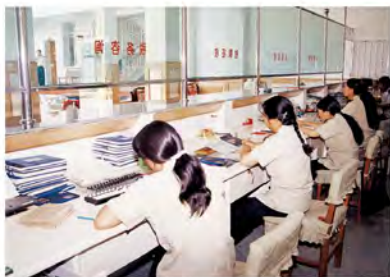
2001年，永胜县地方税务局开展税收票证检查