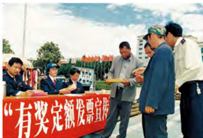
采取多种形式，开展税收宣传