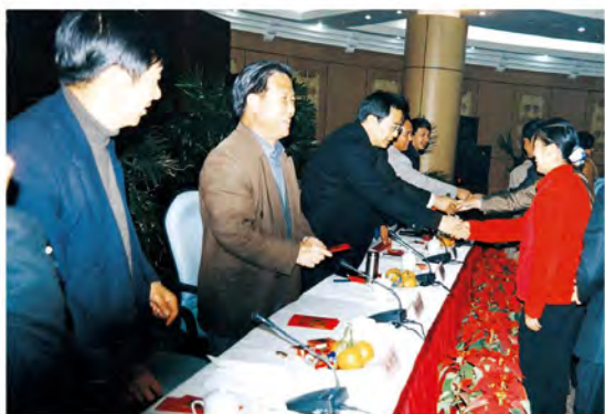
2003年1月，丽江地委书记欧阳坚（左三）为纳税大户颁奖