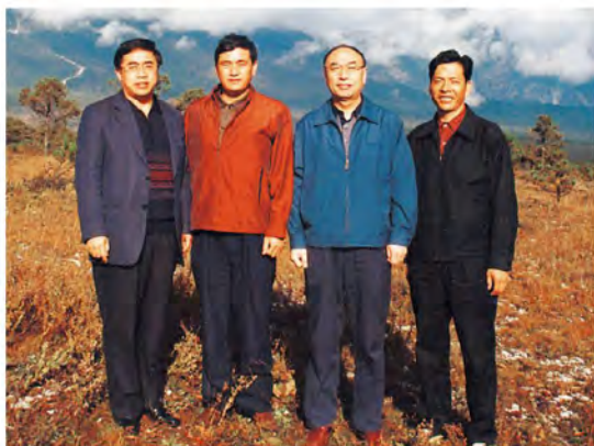
国家税务总局副局长郝昭成（右二）、总经济师董树奎（左一）到丽江视察工作