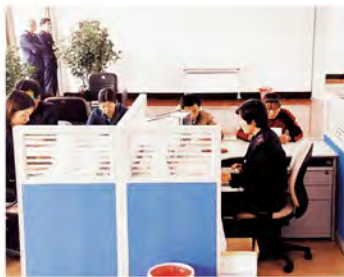
市局直属征收分局开展优质高效的纳税服务