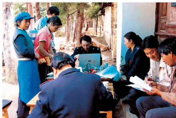
深入农户应用电脑征收农业税