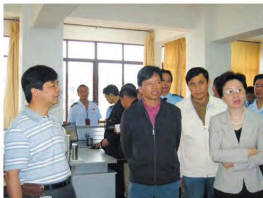
国家税务总局副局长宋兰（右一）到丽江市地税局视察工作