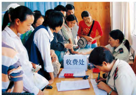
地税干部为纳税人办证