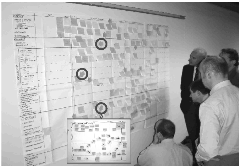
图2 典型路线图研讨会,展现了路线图框架 如何为讨论导向和观点捕捉提供一个结构性框架

虽然具体方法有很大区别,但是把研讨会作为一个关键环节是共同特征。研讨会依托通信和网络发展带来的便利,建立起对所关注的问题的共识,部署将要采取的行动。图2所示的典型路线图研讨会,展现了路线图框架提供的结构如何获取和组织用于引导战略对话的信息。