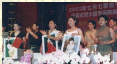
2003年，第二届河北省会七月七爱情节上，对钻石婚、金婚、银婚十佳和十大才女进行了表彰。图为十大才女上台领奖。