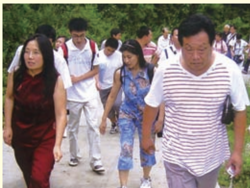
2008年8月7日（七夕节），河北省民俗学者和摄影爱好者一行30余人第二次来到太行东麓的灵寿县织女山区进行游览采风活动。