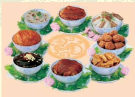
正定宋记八大碗