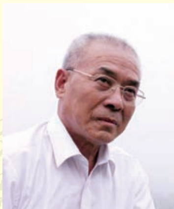
中国工艺美术大师、曲阳石雕大师甄彦苍近影