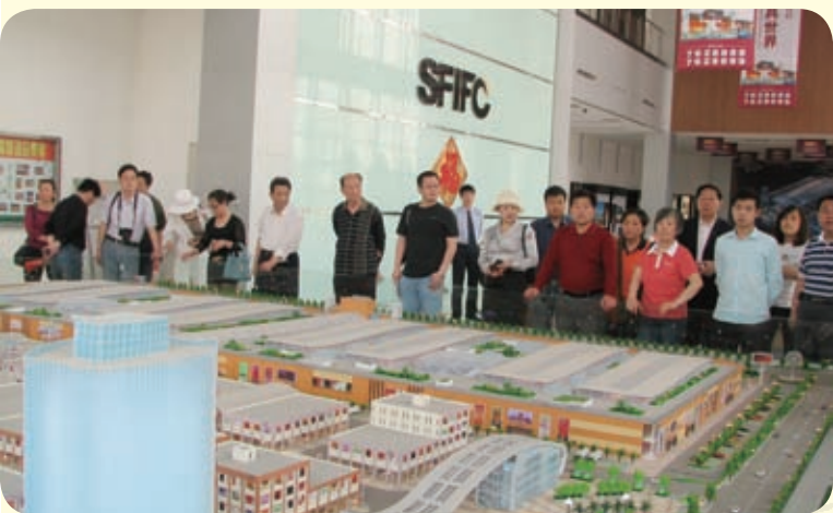
廊坊霸州市胜芳镇的国际家具城一期工程已经完成，这将是全国最大的玻璃钢制家具集散地。图为河北省作家诗人在参观家具城规划沙盘。