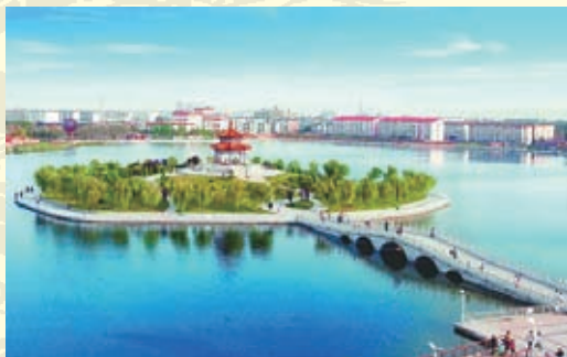
南湖公园是沧州市沿运河修建的“以绿退地、以绿兴城”的运河景观带的重点工程之一，现已成为市民休闲、娱乐的好场所。