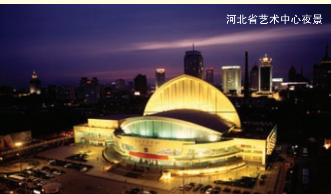
河北省艺术中心夜景