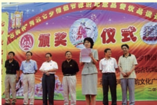
2007年8月，“古韵杯”河北省七夕情人节标识纪念餐餐饮品设计颁奖仪式在省会古韵文化广场隆重举行。