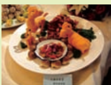
张家口特色名菜 烧羊尾骨