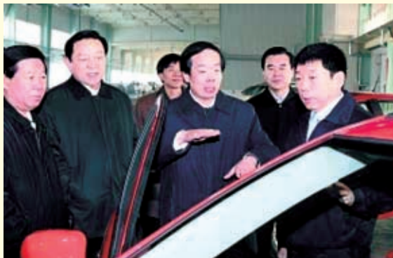
2011年2月17日，省委常委、常务副省长赵勇带领省直相关部门负责人，在保定市委书记宋太平、市长李谦等同志陪同下到长城汽车股份公司考察。