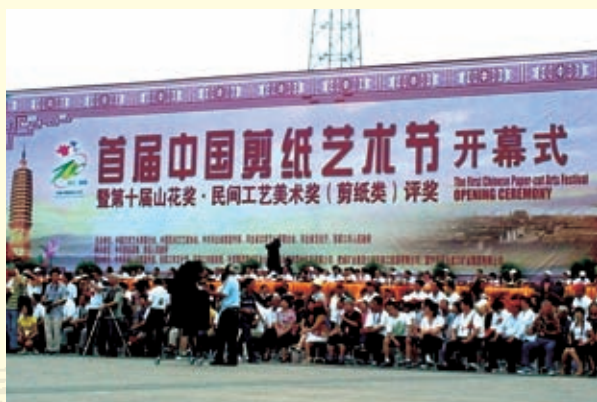
首届中国剪纸艺术节在蔚县开幕