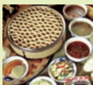
张家口特色 美食筱面窝窝