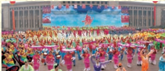
石家庄第三届千人大比舞的红火场面