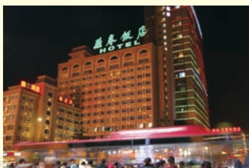
石家庄燕春饭店夜景