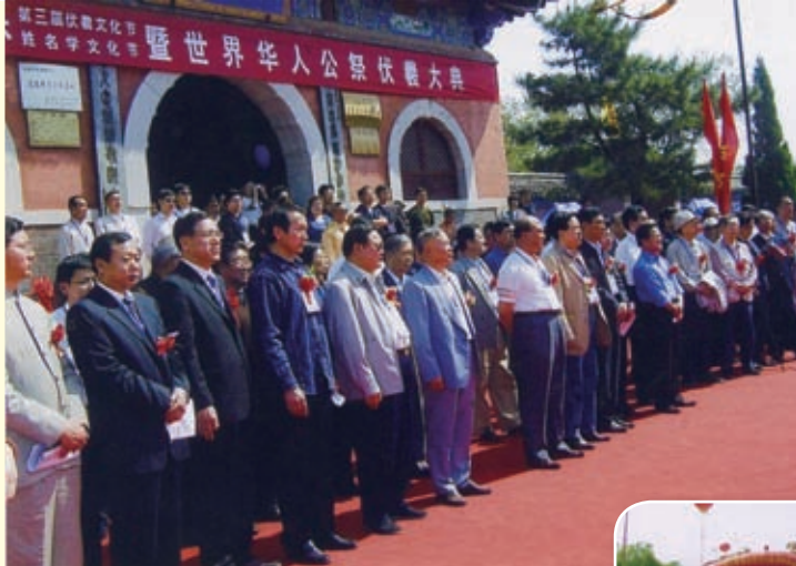
2007年5月2日，国内外专家学者及地方领导人出席了第三届中国新乐伏羲文化节暨世界华人公祭伏羲大典。