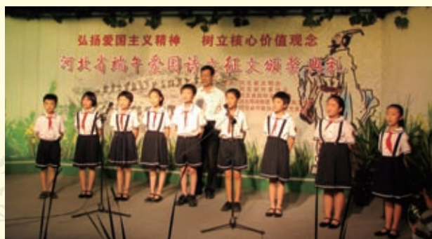
2008年端午节时，河北省文明办、河北省作家协会和河北省民俗文化协会共同举办了端午爱国征文颁奖仪式和优秀作品朗诵演唱活动。此为石家庄范西路小学生在唱端午新歌。