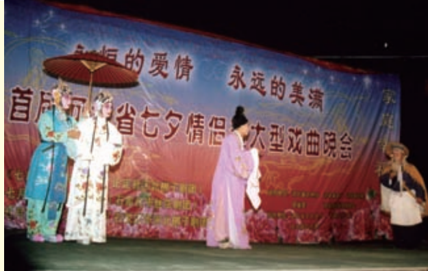
2006年8月初，首届河北省七夕情人节大型戏曲晚会上演出了传统爱情戏曲《白蛇传》等经典剧目。