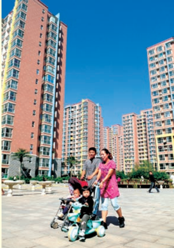
石家庄大马村搬入新居的村民在庄园广场休闲玩耍。