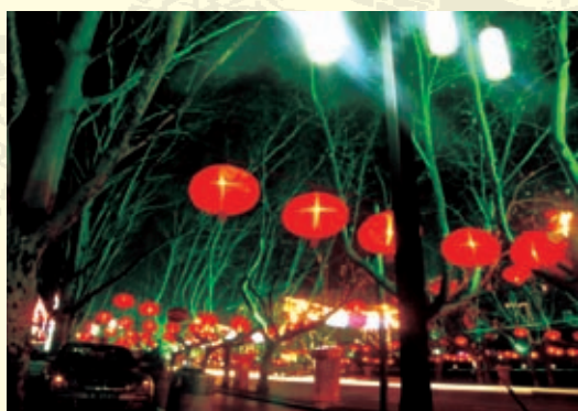
童话世界——邯郸公园夜景