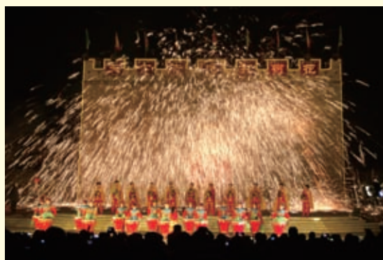
壮观奇幻的蔚县元宵节打树花。