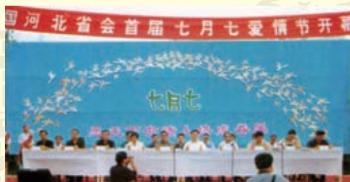
2002年8月，第一届河北省会七月七爱情节开幕式在鹿泉抱犊寨山下举行。