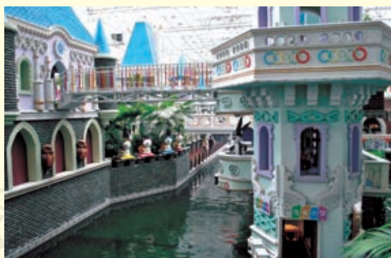
人间天堂——石家庄空中花园一角