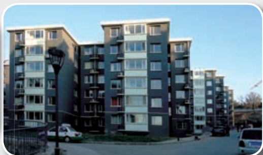
承德市棚户区拆迁后