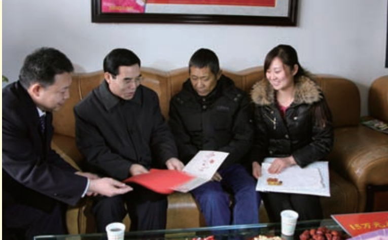
2010年2月，中共河北省委常委、省委宣传部长聂辰席同志前往行唐看望全国道德模范张建霞一家。图为聂辰席（左二）与全国道德模范张建霞（右一）一起读李长春同志致全国道德模范的新春贺信。