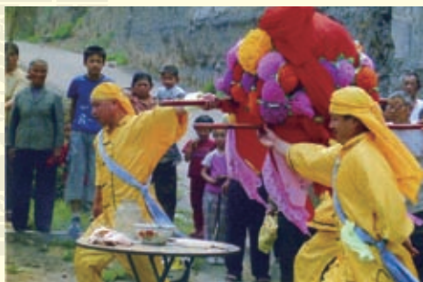
井陘县长岗龙母庙会每年农历四月初一隆重举行，从2007年起转换成新型的长岗龙母文化节。此为2008年第二届长岗龙母文化节上，群众从青龙山迎接龙母回娘家的镜头。