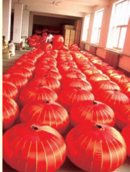
藁城宫灯年产2000万对