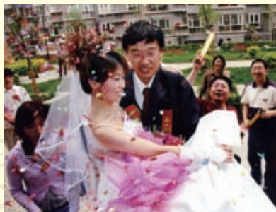
当今的婚礼仪式已经中西合璧，庆典仪式更为丰富多彩。图为新郎抱着新娘入洞房。