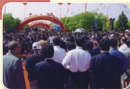
图为第三届中国新乐伏羲文化节暨世界华人公祭伏羲大典主会场。参加群众达3万多人。