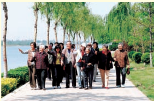
美丽宜人的石家庄太平河畔