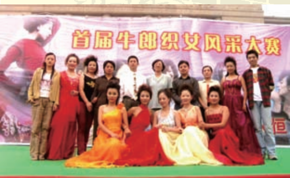
2004年七夕节，在省会文化广场举行了首届牛郎织女风采大赛。图为颁奖仪式后部分获奖者合影留念。