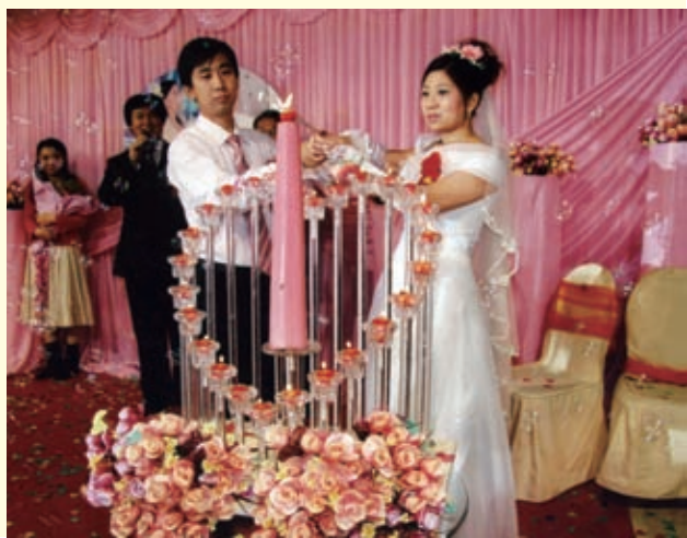
右图为新郎新娘共同心烛。