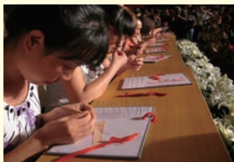
2010年河北省七夕情人节上，巧手姑娘们在穿针引线。