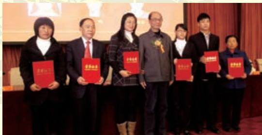
2010年11月12日，在中华新二十四孝颁奖仪式上，省委宣传部原副部长、省社科院原院长、省民俗文化协会名誉会长、博导周振国同志为部分获奖者颁奖后合影。