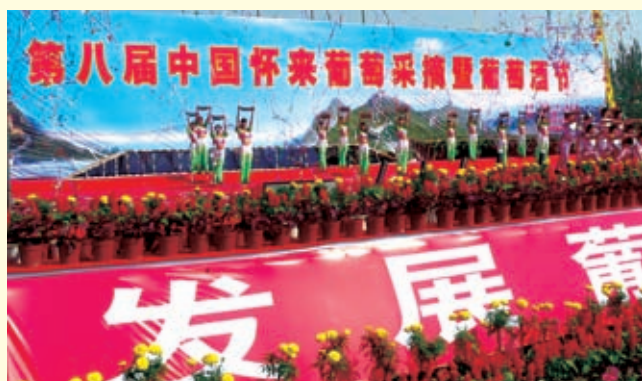
第八届中国怀来葡萄采摘暨葡萄酒节开幕式