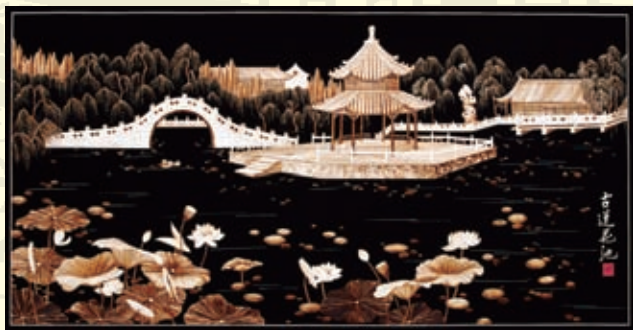
杨丙军代表作《古莲花池》