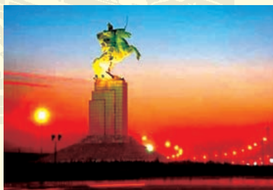
红火的不夜城——邯郸