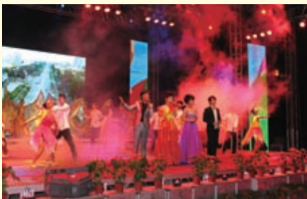
2010年5月28、29日，省会民心大舞台演出活动热烈进行