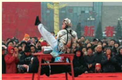
省会春节期间街头戏剧表演活动