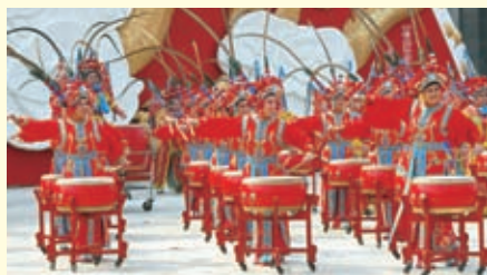
藁城女子战鼓队的表演

石家庄连续5年在农历二月二举行鼓王争霸赛，第5年联络省内外知名战鼓队参加比赛，表演活动更为丰富多彩。