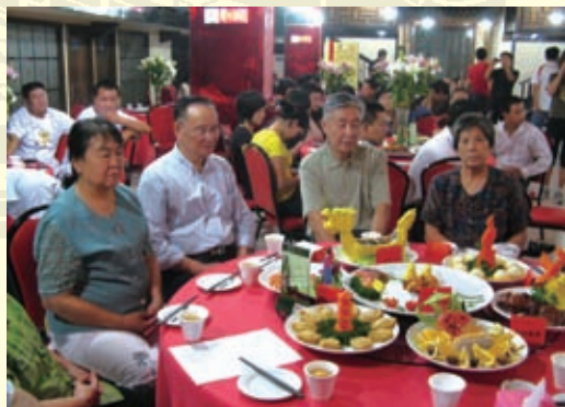
在2009年七夕节前，全省进行了七夕情侣宴创新征集活动。在河北省文明办、省民俗文化协会举办的河北省百家饭店情侣宴服务、百家花店百合花展示启动仪式上，11家饭店亮出了他们的情侣宴。图为情侣宴的一种。