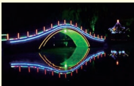
一只美丽的眼睛——邢台公园一角