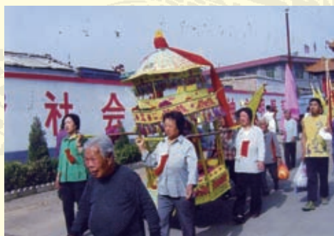
长岗龙母文化节上的群众游行队伍