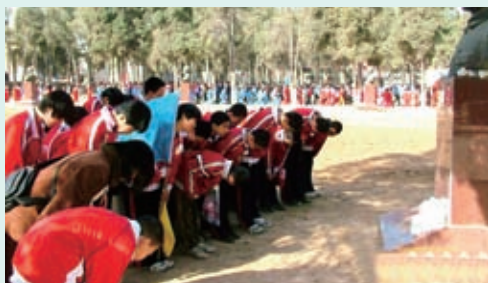
2010年清明节时，石家庄第九中学师生到华北烈士陵园参加清明扫墓活动。图为他们向烈士铜像鞠躬，表达深深敬意。