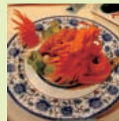
张家口地方名菜 龙舟九肚鱼