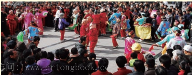
城市大广场上的民俗艺术表演活动