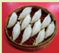
张家口筱面饺子 风味不同于白面 饺子