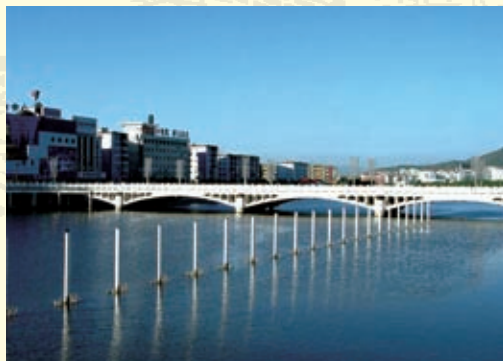
澄碧的张家口清水河

在“三年大变样”活动开展以来，全省各城镇普遍旧貌换新颜，极大地改善了河北人民的生存环境和客商投资环境。此为保定火车站新景。