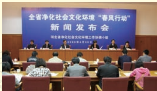
2009年4月30日，河北省净化社会文化环境“春风行动”新闻发布会召开。