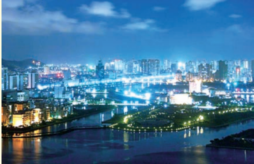
壮丽辉煌的邢台之夜