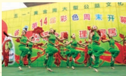
2010年省会第14届彩色周末开幕式演出场面