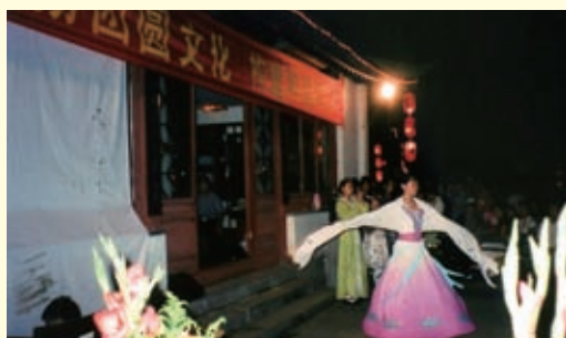
2008年9月中秋节之夜，河北省茶文化研究会、省民俗文化协会和“三字禅”茶院共同举行了拜月赏月活动。图为独舞“明月几时有”的表演。