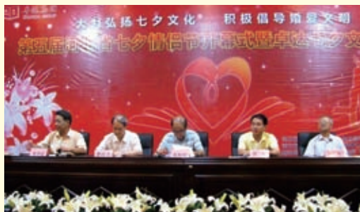
这是第五届河北省七夕情人节开幕式暨卓达七夕文化论坛主席台上。