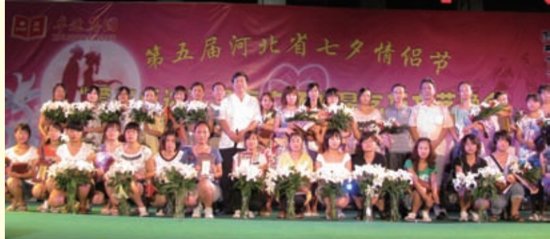
2010年8月，第五届河北省七夕情人节上，60多位女青年参加了穿针乞巧比赛。这是颁奖仪式后获奖者在台上合影留念。