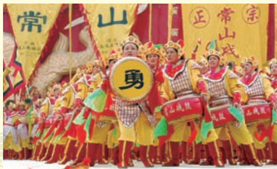
正定东杨庄的常山战鼓表演