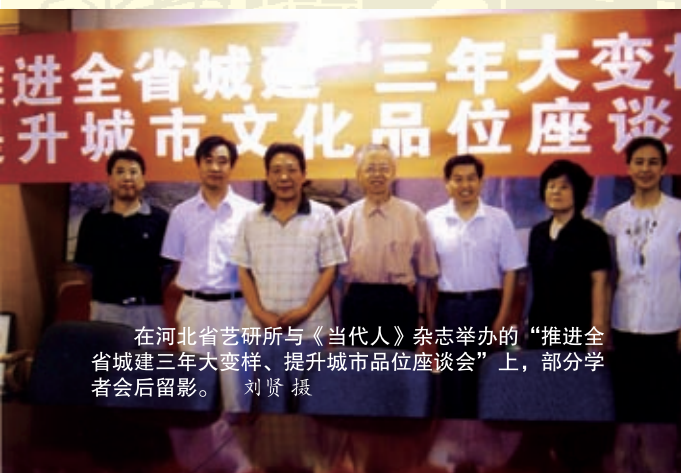
在河北省艺研所与《当代人》杂志举办的“推进全省城建三年大变样、提升城市文化品位座谈会”上，部分学者会后留影。