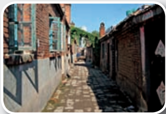
承德市棚户区拆迁前