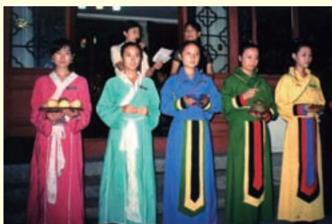
2010年中秋拜月赏月活动一瞬