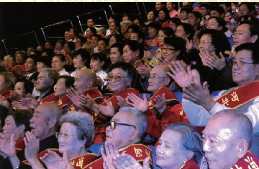
2008年10月7日，河北省文明办、团省委、省妇联、省老龄委办公室和省民俗文化协会联合主办的河北省“颂重阳”钻石婚金婚双十佳颁奖晚会在省电视台演播厅热烈举行。