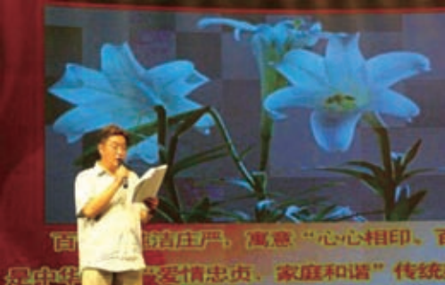
2010年8月14日，“我们的节日——七夕”首届中华爱情节在秦皇岛隆重开幕。这是主持人宣布：百合花当选中国爱情花。