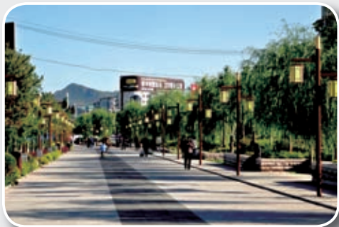
承德市中心铁路拆迁后