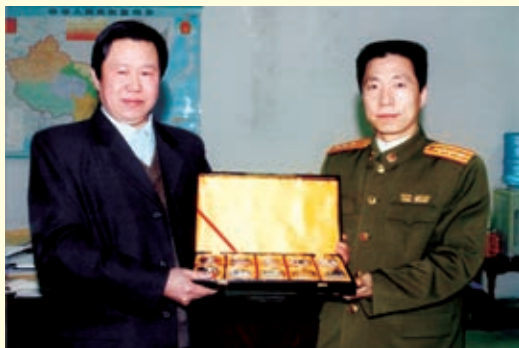
这是张汝财与航天英雄杨利伟合影