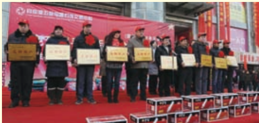
2010年12月28日上午，河北省文明办、市妇联等单位在自由港商业广场隆重举行“寒冷冬天有阳光、扶贫帮困心连心”大型公益活动。这是“文明商户”和“诚信商户”上台领奖。