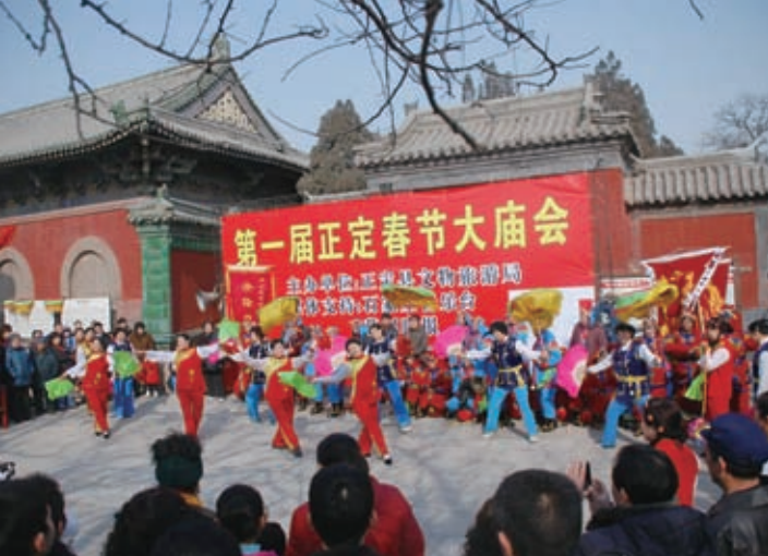
2008年农历正月初一，第一届正定春节大庙会活动如火如荼。