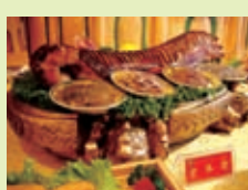
张家口特色 全羊席