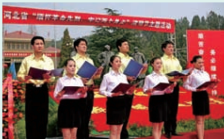
2009年4月清明节前，河北省委宣传部、省文明办等单位共同在西柏坡组织举行了“缅怀革命先烈，继承革命遗志”活动启动仪式。