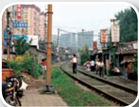
承德市中心铁路拆迁前