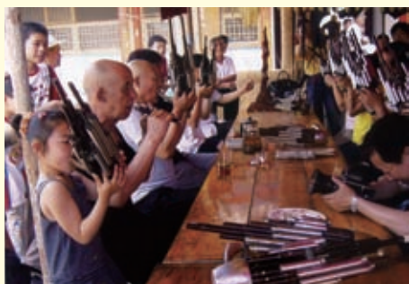
2008年5月24日，一年一度的安新县白洋淀圈头乡药王庙会上，冀中音乐会老少成员在专心致志地进行演奏。