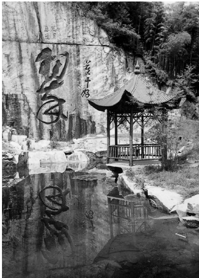
图 1-1 莫干山

德清“四山一水五分田”。县境山地丘陵面积 341.28 平方公里，占全县总面积的 36.48%；平原面积 456.05 平方公里，占全县总面积的 48.74%；水域面积 138.35 平方公里，占全县总面积的 14.78%。素有“鱼米之乡、丝绸之府、名山之胜、竹茶之地、文化之邦”之美誉。境内有中国四大避暑胜地之一的国家级风景名胜区莫干山，江南最大湿地、防风古国故里下渚湖，东部千年水乡古镇，素有“千年古运河、百年小上海”之誉的新市(图 1-1、图 1-2、图 1-3、图 1-4)。