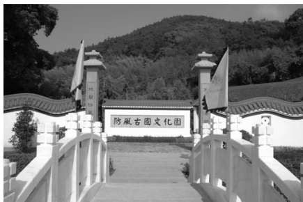
图 1-3 防风古国文化园