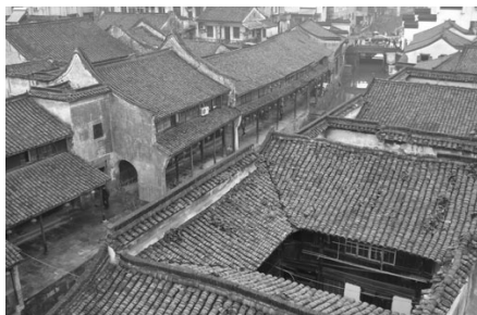
图 1-4 新市古镇

县境地势自西向东倾斜。西部为天目山余脉,群山连绵,林木葱郁,有 700 米以上的五指山、黄回山、塔山(莫干山主峰)、天山、倍顶山等五座山峰,国家级著名风景区莫干山就在境内,区内以早园竹、毛竹生产为主,是全县竹木生产基地。中部属湘溪、余英溪、阜溪“三溪”河谷,为山区向平原过渡地带,主产粮、畜、林、茶。东部在东苕溪导流以东,地势低洼,海拔 3.5 米左右。古运河流经县境东南,东苕溪斜贯东北,这里河港纵横,漾荡星罗棋布,属杭嘉湖平原水网地带,为全县粮食、蚕茧、淡水鱼、畜禽的主要产区。全县以粮桑生产为主,林、牧、副、渔全面发展。