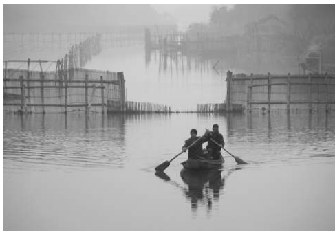
图 1-2 下渚湖