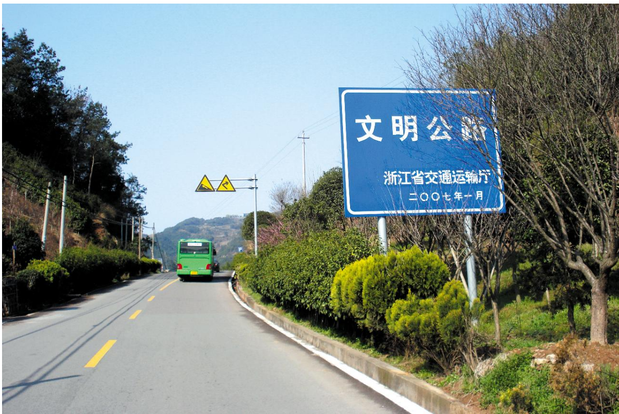
2007年1月, 浒溪线奉化段荣获浙江省文明样板公路称誉