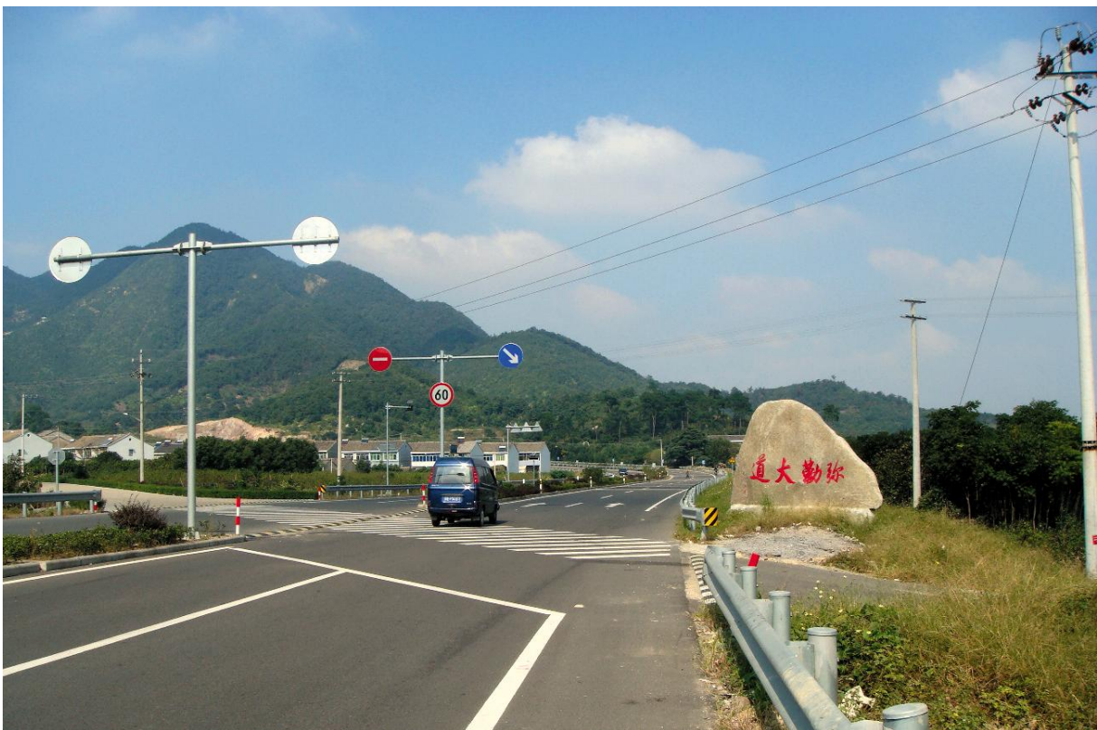
2007年11月19日,浙江省首条生态公路——奉化弥勒大道正式通车