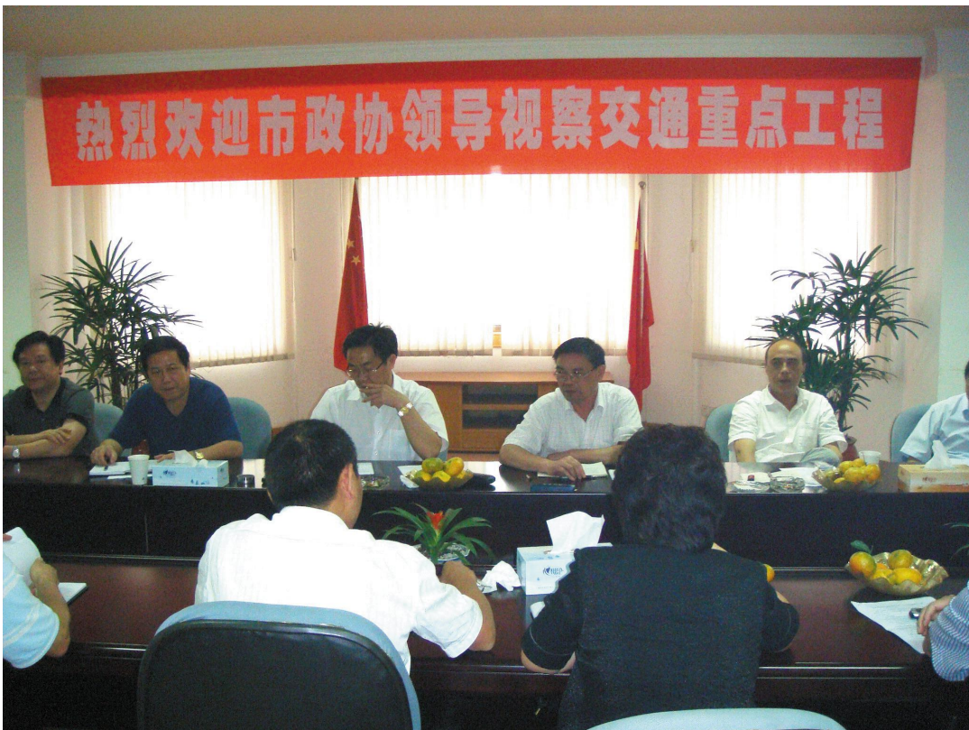
2007年9月25日,奉化市政协领导视察交通工作