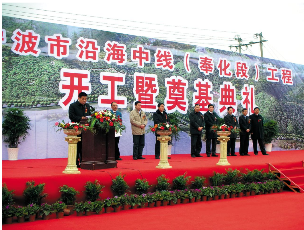
2008年12月28日,宁波市沿海中线奉化段举行开工暨奠基仪式