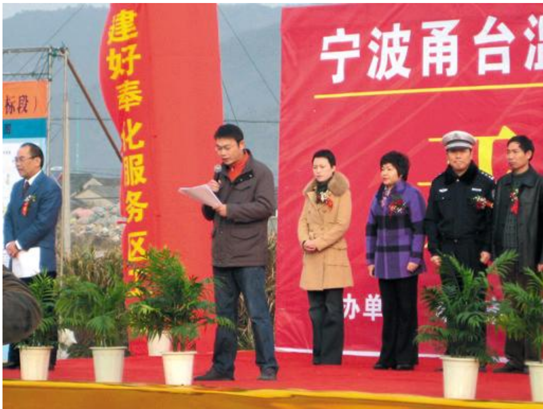
2008年12月27日,甬台温高速公路奉化服务区开工典礼