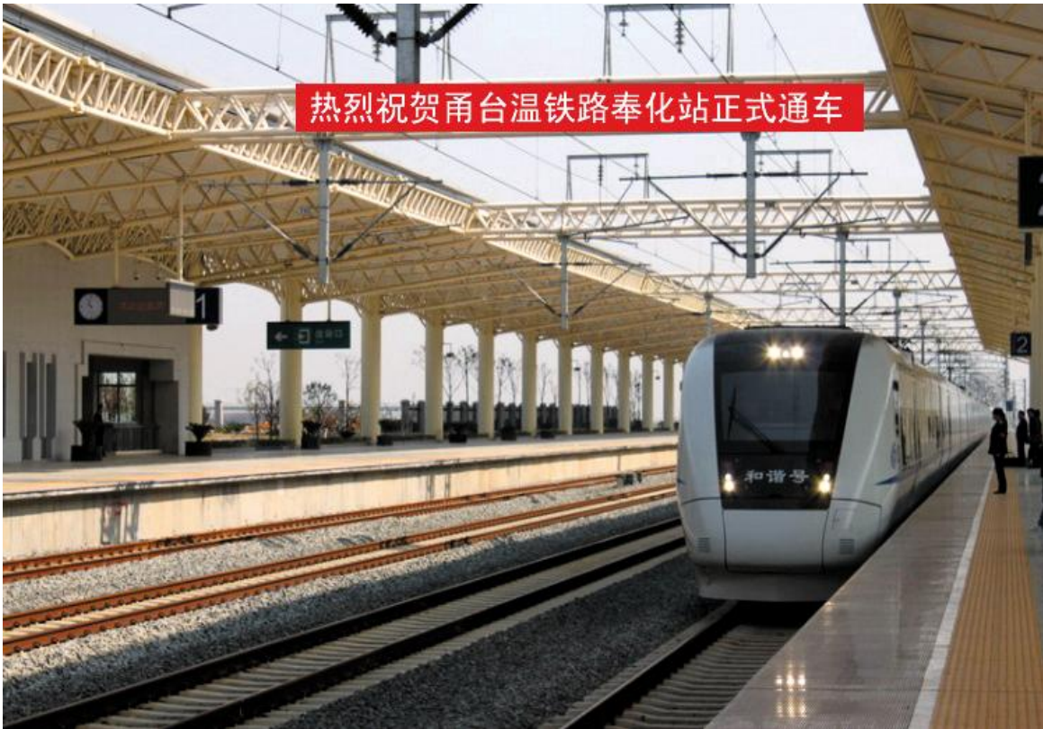
2009年9月28日,甬台温铁路奉化段正式通车运行