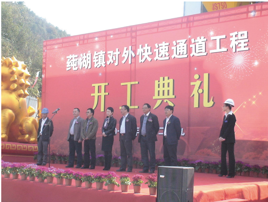
2010年3月29日,蕪湖鎮對外快速通道工程舉行开工典禮