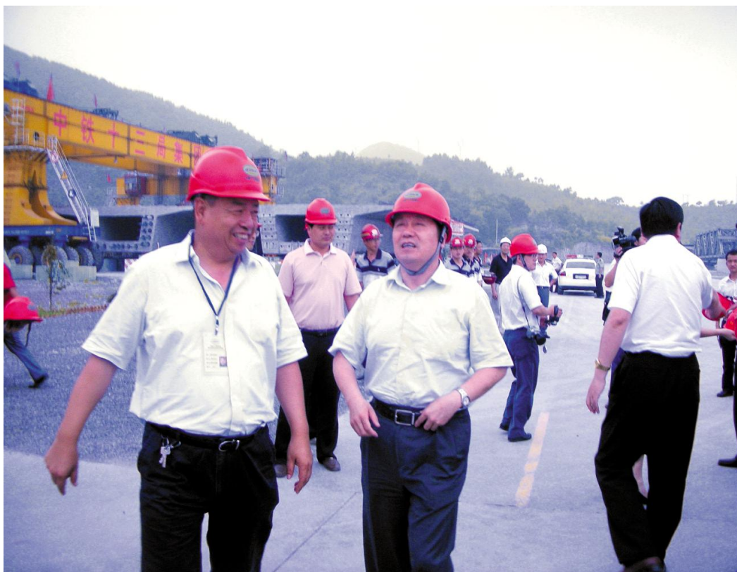
2008年6月24日,浙江省副省长王建满(左三)视察甬台温高铁工程