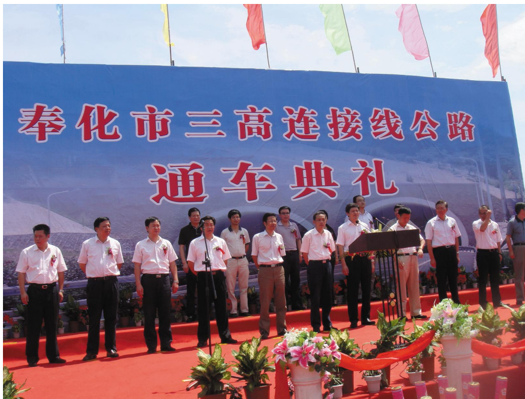
2009年7月21日,奉化市三高连接线公路举行通车典礼