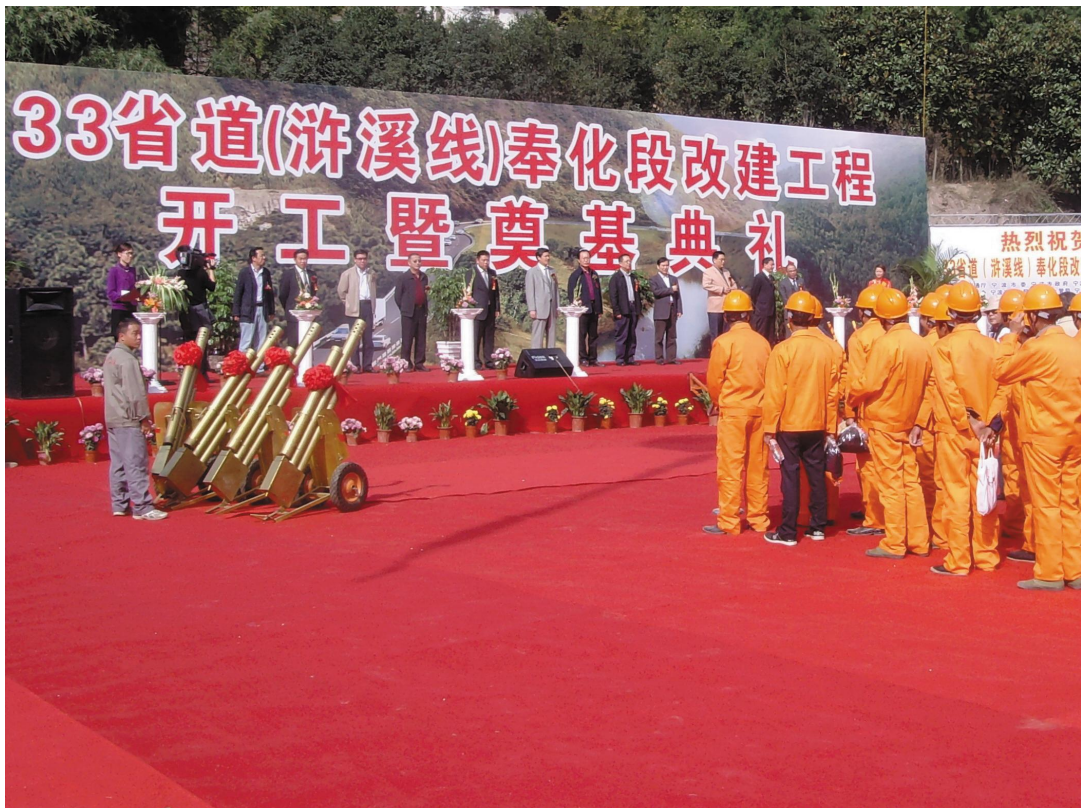
2009年11月6日,33省道(浒溪线)奉化段改建工程举行开工典礼