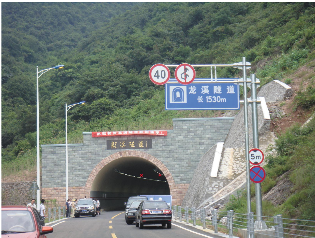
2001年8月18日,龍溪隧道正式通车