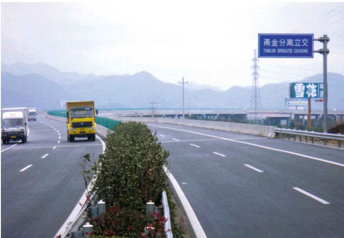
甬金高速公路分离立交桥