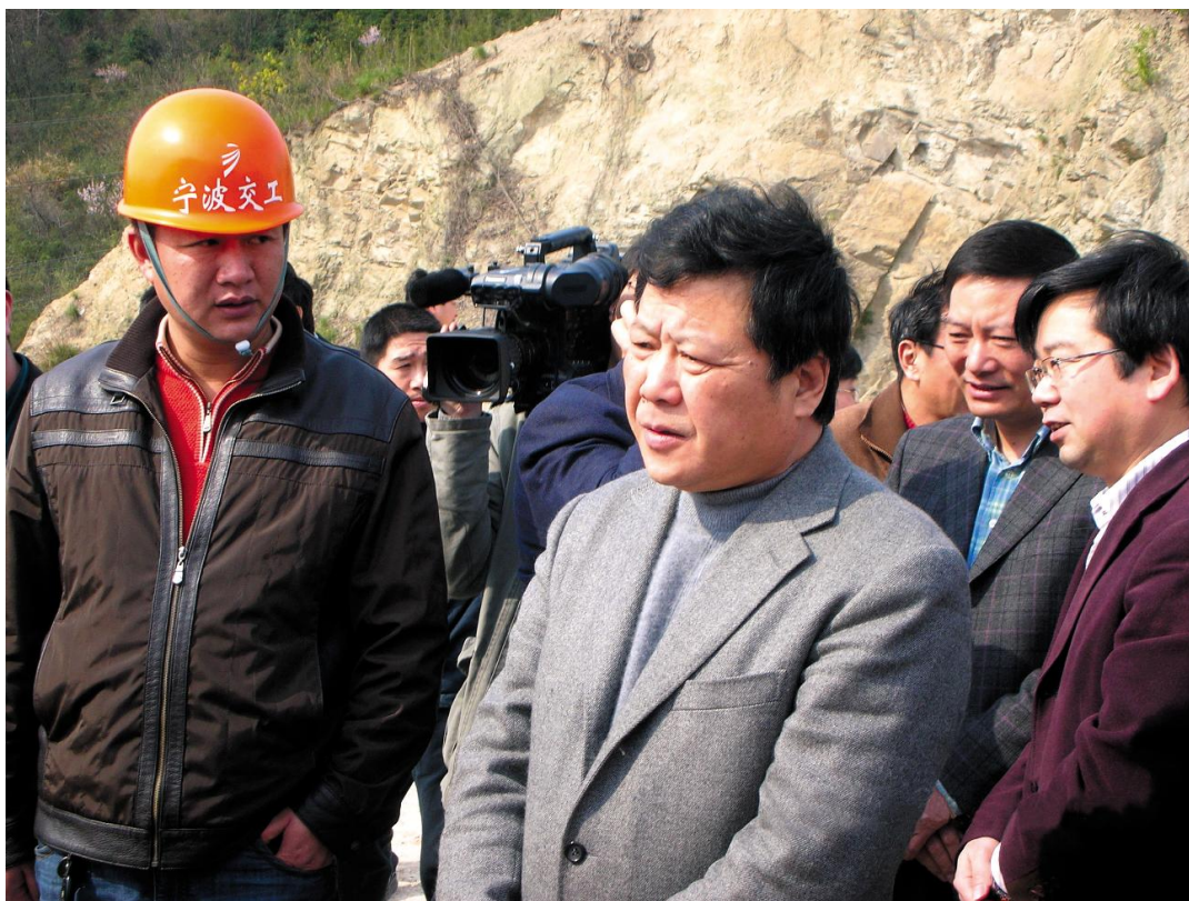
宁波市常务副市长王勇(左二)视察宁波市沿海中线奉化段