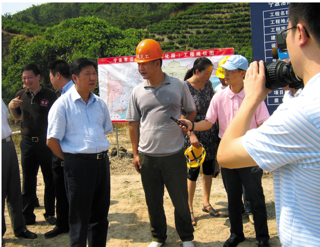
2009年8月21日,宁波市市长毛光烈(左三)视察宁波市沿海中线奉化段