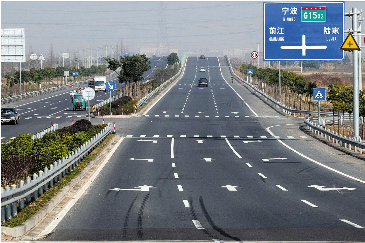
2009年7月21日,三高连接线(下王至朝阳)建成通车