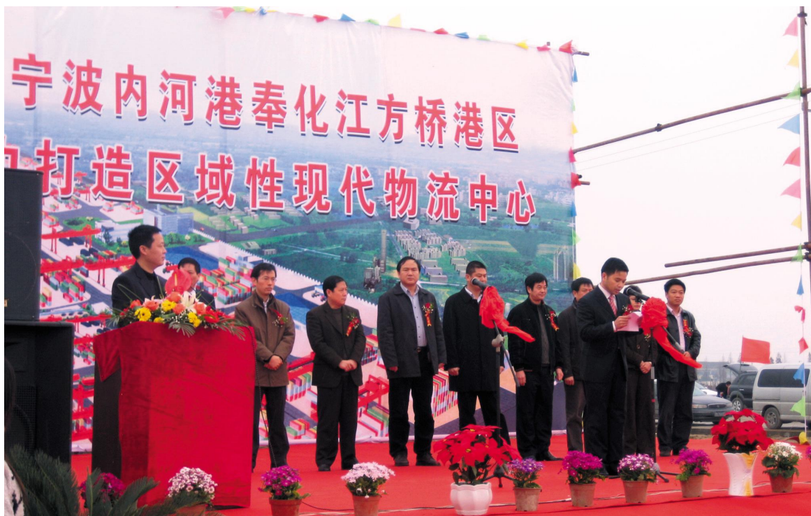
2007年12月28日,宁波内河港方桥港区举行开工典礼