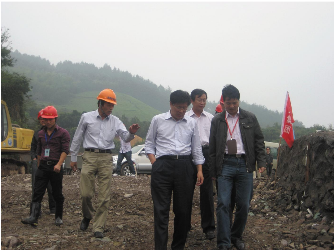
2010年10月10日,交通部领导(左三)亲临建设工地进行现场督查