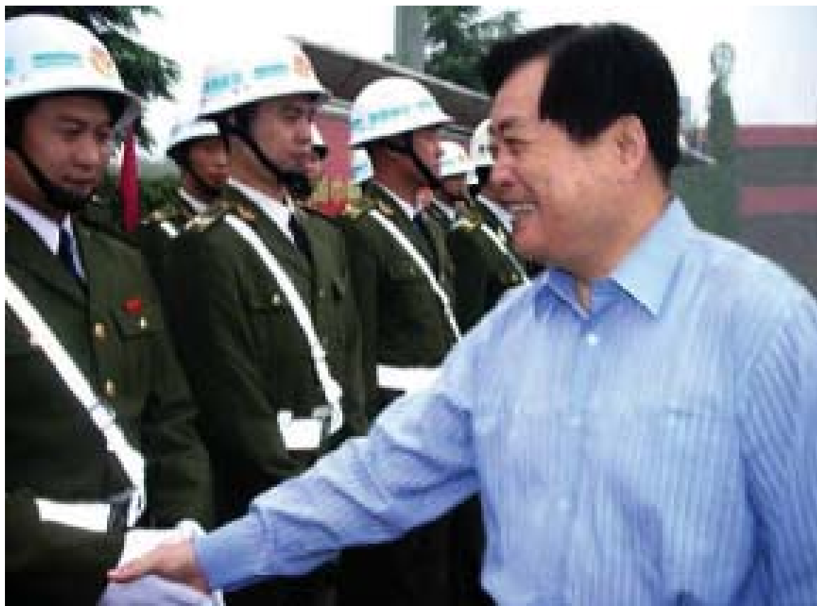
2007年，四川省省长蒋巨峰慰问一线执法人员。