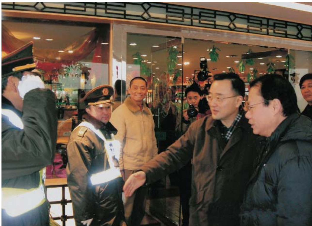
四川省交通厅厅长高峰（右二）看望慰问一线执法人员。