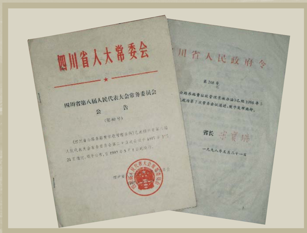
1997年2月四川省人大常委会公告（第80号）《四川省公路养路费征收管理条例》和1998年5月四川省人民政府令（第108号）《四川省公路养路费征收管理实施办法》。