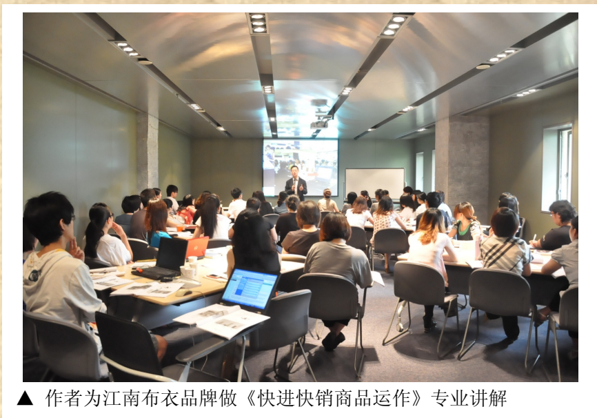
▲ 作者为江南布衣品牌做《快进快销商品运作》专业讲解