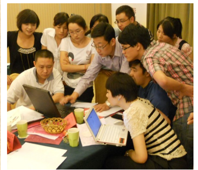
▲ 作者辅导红蜻蜓鞋业的商品经理进行《年度商品计划》演练