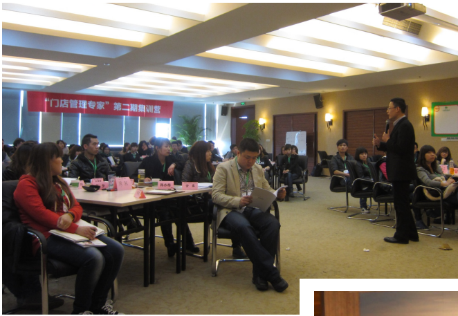
▲ 作者为森马品牌总部直营系统做《终端商品数据分析提升》讲解