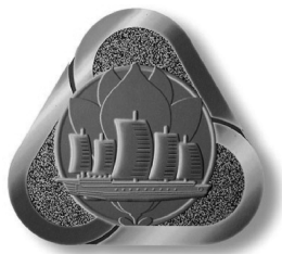
图 1 上海市市标

上海市市标 1990 年经上海市人大常委会审议通过。上海市市标是以市花白玉兰、沙船和螺旋桨三者组成的三角形图案。三角图形似轮船的螺旋桨,象征着上海是一座不断前进的城市;图案中心扬帆出海的沙船,是上海港最古老的船舶,它象征着上海是一个历史悠久的港口城市。沙船的背景是迎着早春盛开的白玉兰,展示了灿烂辉煌的明天。