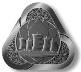
图 1 上海市市标

上海市市标 1990 年经上海市人大常委会审议通过。上海市市标是以市花白玉兰、沙船和螺旋桨三者组成的三角形图案。三角图形似轮船的螺旋桨,象征着上海是一座不断前进的城市;图案中心扬帆