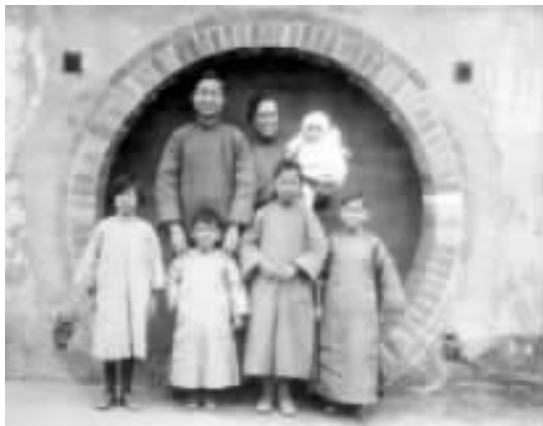
晏阳初一家在定县