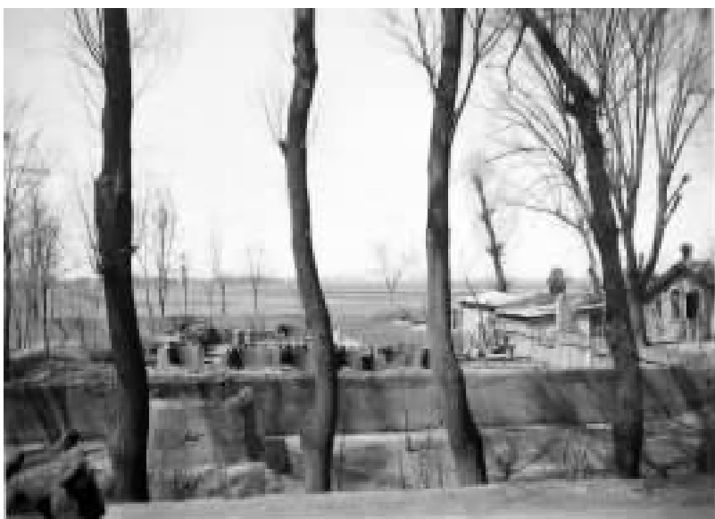
20 世纪 30 年代的平教会所在地——河北省定县翟城村