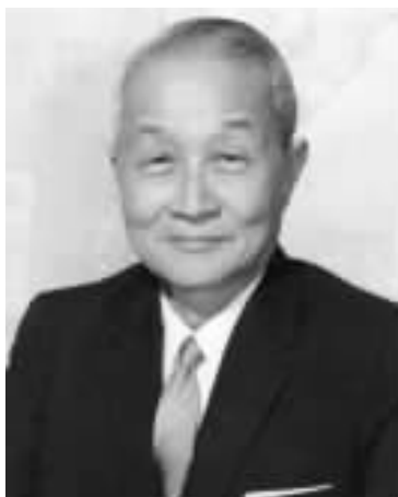
晏阳初 (1890 ~ 1990)

当代世界著名的平民教育家晏阳初博士 (1890 ~ 1990)，祖籍四川巴中。1926 年至 1936 年他率领的“中华平民教育促进会总会”（简称“平教会”），在河北定县（定州）搞了长达 10 年的平民教育和乡村建设运动。