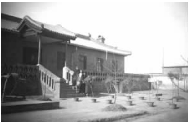
定县平教会会址原貌