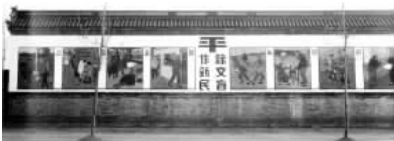
用农民看得懂的方式办教育

家才能富。看起来这很简单，真理却存在其中。我们今天要相信的就是‘民为邦本，本固邦宁’，我们应该努力的是固本的工作。”晏阳初说：“中国有金矿、煤矿，这矿那矿，但最重要的还要重视开发‘脑矿’，‘世界最大的脑矿在中国’，‘要充分发掘劳动人民的潜在力’，把十亿人民的脑矿开发出来就是对人类最大的贡献。知识分子必须深入民间，到群众中去，‘博士下乡’，为广民众服务。”