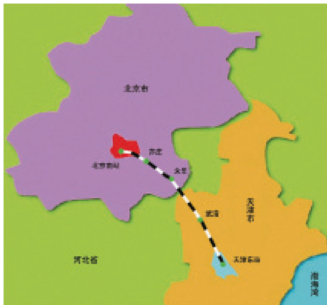
图1-3 北京大型交通设施规划建设

此外，中关村国家自主创新示范区、永定河绿色生态发展带、城乡一体化改革、新农村规划建设等重大项目也在酝酿或已经开始实施。