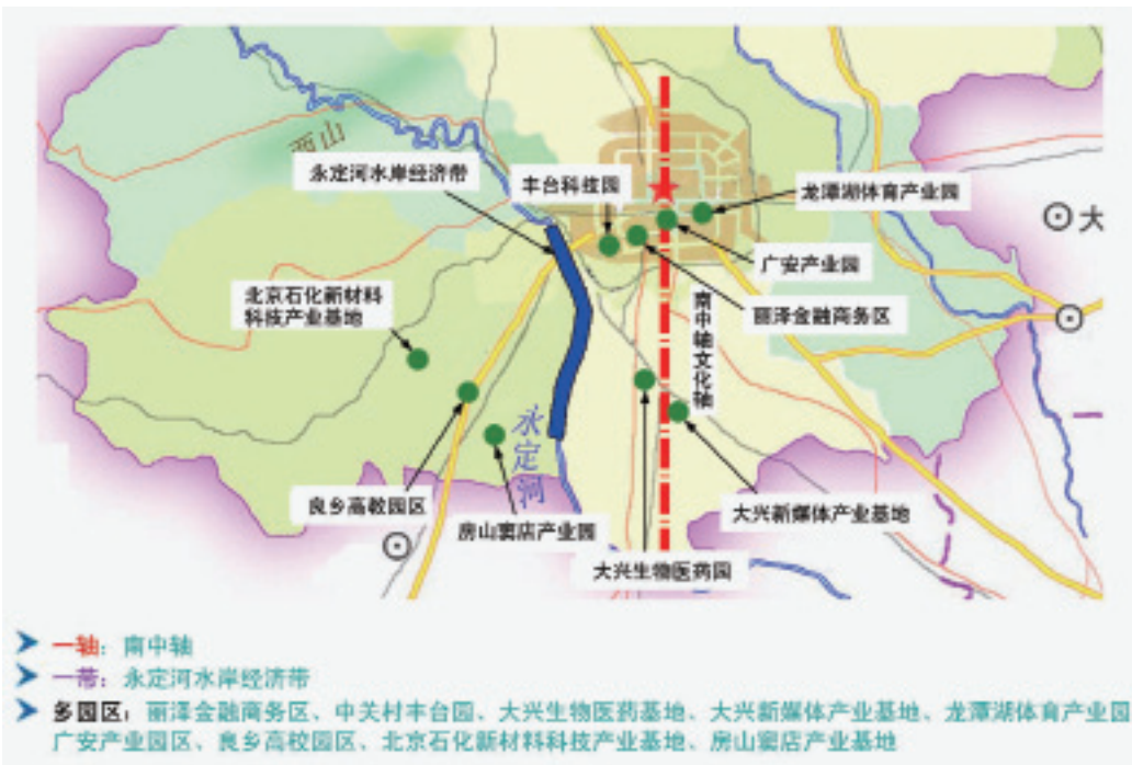
图1-2 北京南部地区产业发展格局