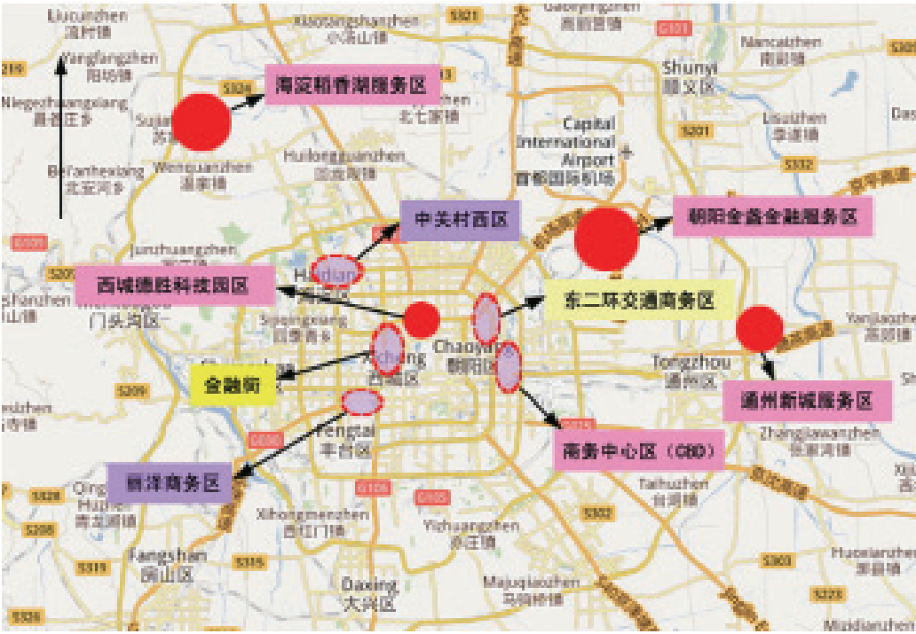
图1-1 “一主一副三新四后台”的金融业布局