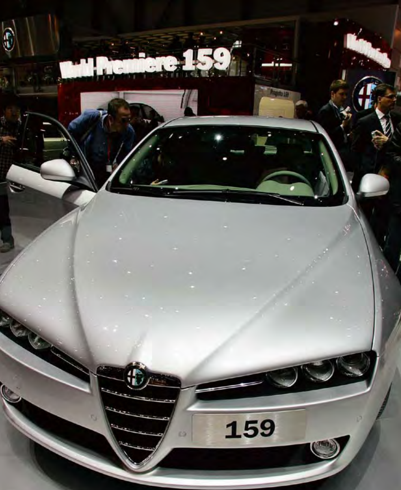
日内瓦车展素有“汽车潮流风向标”的美誉，它也是欧洲唯一一个每年举办一次的车展，图为2005年第75届日内瓦国际车展上的阿尔法·罗密欧159型轿车。