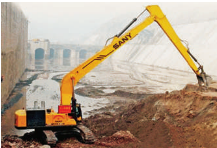
图 1.4 向家坝水电站施工现场加长臂挖掘机的应用

3. 挖掘机的应用：2008 年 11 月在国家大型项目向家坝水电站施工现场，数台三一 SY850 型加长臂挖掘机（见图 1.4）长臂挥舞、英姿飒爽，在众多参与施工的工程机械设备中尤为醒目。这几台挖掘机自进入向家坝水电站至今，运行稳定，表现出色，圆满完成了大江截流、土方转移等重要工程项目施工，得到客户和建设方的一致赞誉。向家坝水电站工程建设由葛洲坝集团承建，是国家重点项目。建成后的向家坝水电站将是国内第三大水电站。