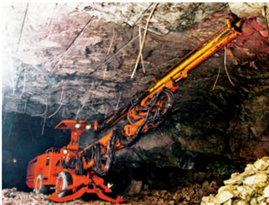
图 1.3 遥控凿岩机的应用

电遥控系统控制液压机械。即使在能见度较低、环境恶劣的地方，也可以方便控制重型凿岩机进行钻孔作业。操作员可以选择安全地点对位钻孔，而不必待在钻孔机的操作台上。无线电遥控装置配有数据反馈装置，通过 20 毫安电流环或 V 24 通讯协议将钻孔机的工作状态信息传递给发射机。在钻孔机钻孔作业中，孔的坐标在操作员的发射机的 LCD 液晶显示屏上显示，操作员根据显示的坐标信息来控制钻机的空间位移。在位移过程中，反馈系统将钻机的位移坐标在 LCD 显示屏上“实时”显示。此外，在无线电控制装置的显示屏上会将凿岩机的故障信息全文显示出来。无线电控制装置采用 IP65 保护标准，完全适应在潮湿和含盐的环境中使用。