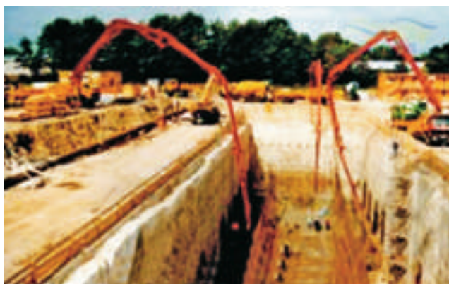
图 1.2 多台混凝土泵车在地基施工中的应用

2. 凿岩机的应用：在建筑、采矿及公路隧道施工中，凿岩机通常都是在极恶劣的环境条件下工作。灰尘、潮湿、坠物等都可能伤害操作人员。为了减少事故、改善工作条件，目前无线电遥控技术投入使用。在使用遥控系统操作这些液压机械凿石、钻孔时，操作员可自由选择安全地点，再也不用像以前在机械操作台上担惊受怕了（见图 1.3）。对于隧道里能见度较低的场合下，可选用配有反馈装置的无线