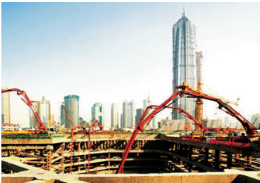
图 1.1 多台混凝土泵车在高层建筑工程中的应用

现在采用无线电遥控系统就可以解决这个问题。泵车司机在工作地点驾车定位后，即可用便携式无线电控制装置依次操作泵车的各个动作，液压支架的升、降；泵车的水平校正；布料杆的左右回转；多级杆的变幅升降等。混凝土经混凝土泵，沿着多节可折叠的料杆被输送到软管喷口。泵车司机可远离泵车控制台，直接站在软管喷口旁边观察混凝土泵送情况，控制布料杆的动作和混凝土泵的运作。随着无线电遥控装置在混凝土泵车的广泛运用，泵车也在向超高度、大排量方向发展。如今世界上最大的无线电遥控混凝土泵车，布料杆长度 62 米，垂直泵送距离超过 100 米，排量可达 200 立方米/小时，国内的生产厂家有中联重科、湖南三一重工、徐州混凝土机械厂等。