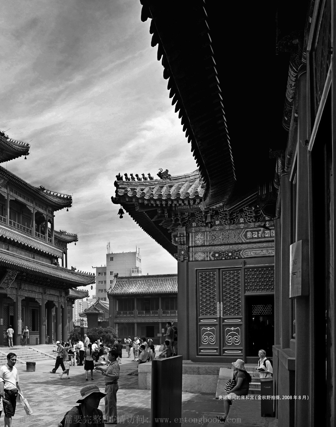
奥运期间的雍和宫 (2008年8月)