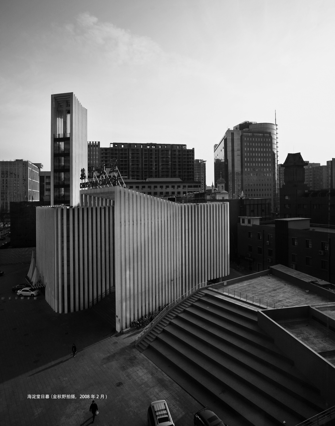
海淀堂日暮 (2008年2月)