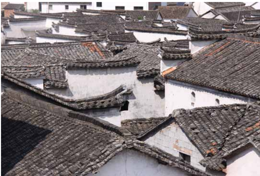
村落丰富变化的屋顶