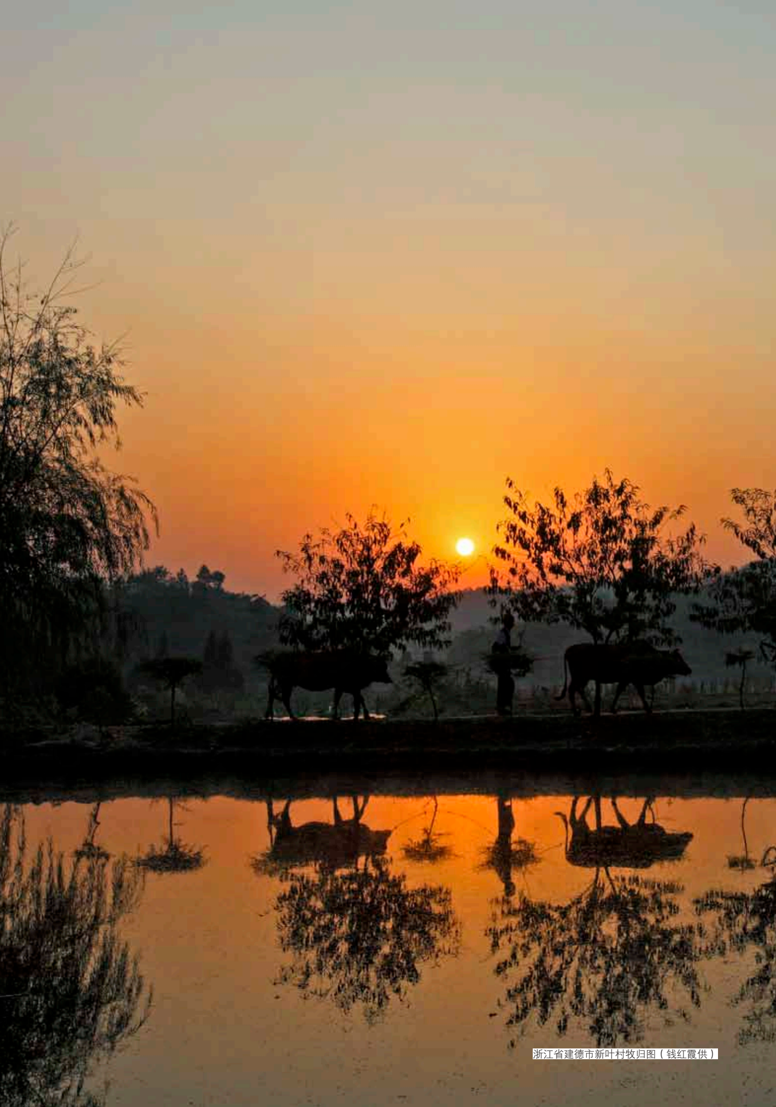
浙江省建德市新叶村牧归图