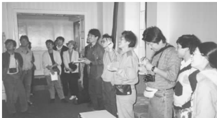
图6 1989年4月烟台实测活动

1989年6月,《中国近代建筑总览·天津篇》在东京问世 ② ,标志中日合作取得了初步成果;1991年10月,中日合作进行了16个城市(地区)的近代建筑调查已全部完成,填制调查表2612份,中日合作圆满完成;至1996年2月,《中国近代建筑总览》出版16个分册(参见附录1) ③ (图7)。