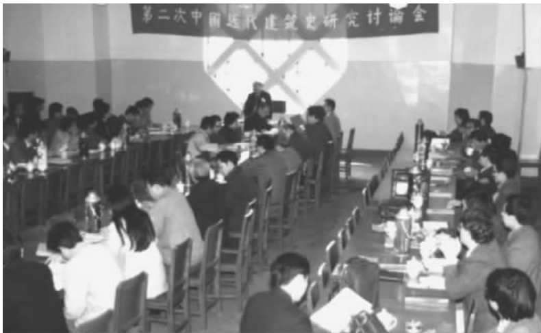
图8 1988年4月第二次研讨会,武汉