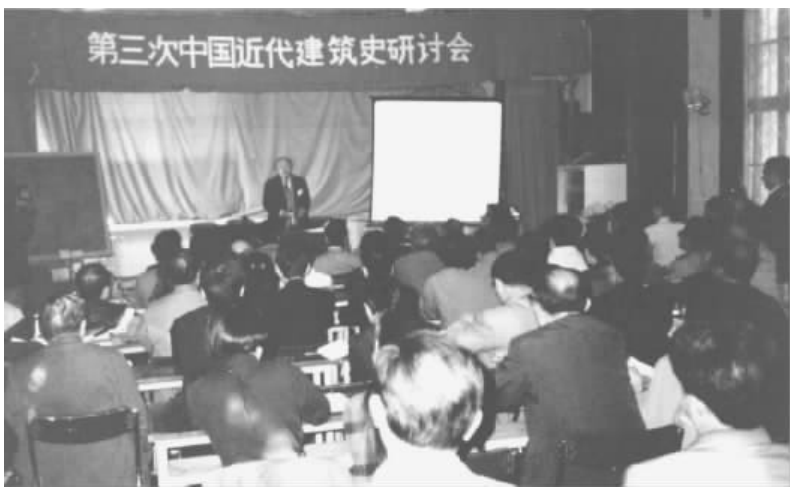
图9 1990年10月第三次研讨会,大连