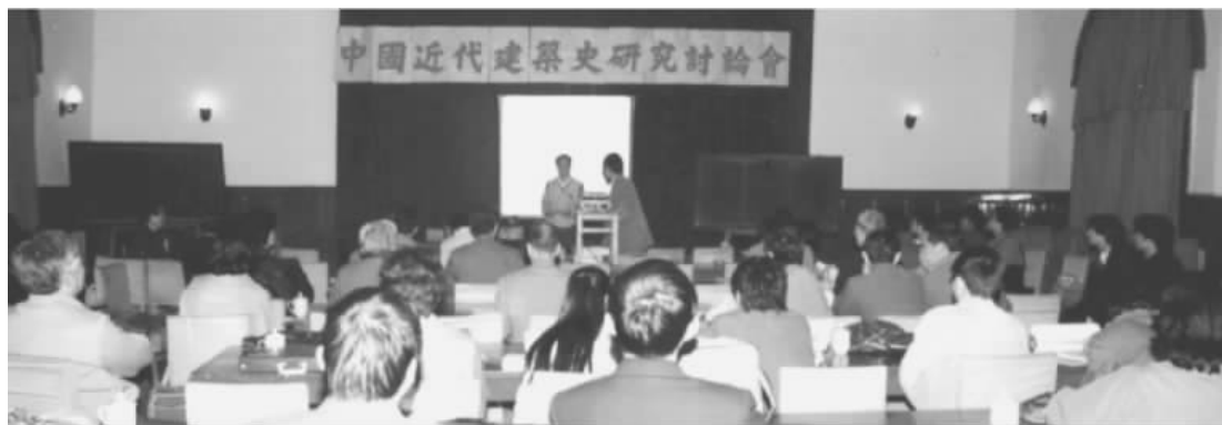
图4 1986年10月第一次研讨会,北京

1986年10月,“中国近代建筑史研究讨论会”在北京召开。这是继“中国近代建筑史研究座谈会”之后,中国举行的第一次全国性研究中国近代建筑史的学术会议,是第二时期中国近代建筑史研究正式起步的标志 ⑥ (图4)。