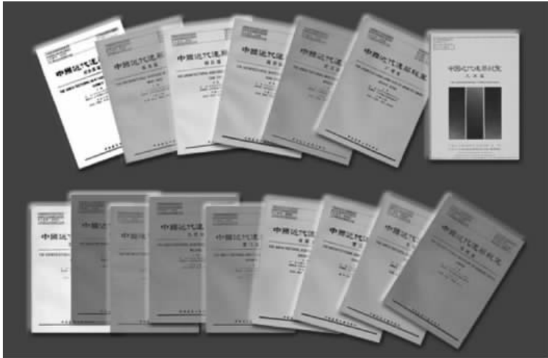
图7 《中国近代建筑总览》16个分册