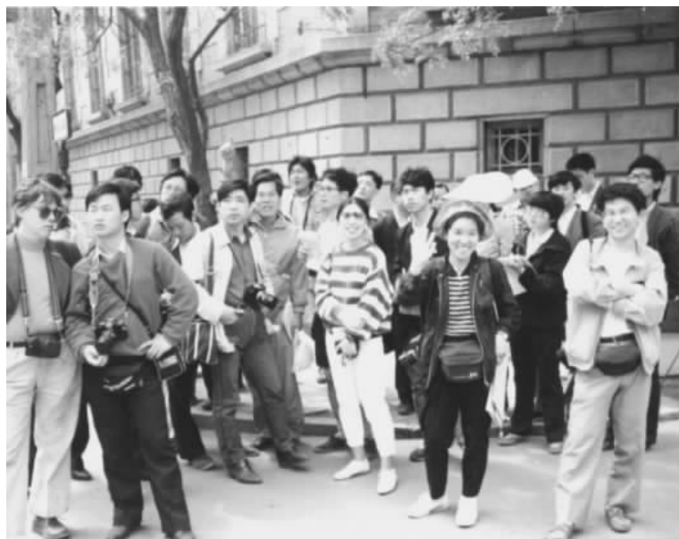
图5 1988年5月天津讲习班考察

1988年5月,“中国近代建筑讲习班”在天津举办(图5);1989年4月,中日合作在烟台联合进行主要近代建筑实测活动 ① (图6)。