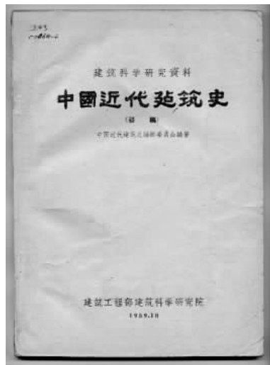
图1 中国近代建筑史(初稿).1959

1960年8月,全国“第四次建筑历史学术讨论会”后根据《中国近代建筑史》(初稿)缩编的《中国建筑史》第二册《中国近代建筑简史》,成为“高等学校教学用书”于1962年10月正式出版 ① (图2)。1964年在香港出版的徐敬直所著《中国建筑之古今》一书 ② ,其中有“当代中国建筑”(Contemporary Chinese Architecture)部分,是关于中国近代建筑史研究的较重要的专著(图3)。