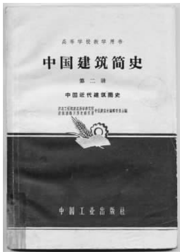
图2 中国近代建筑简史.1960