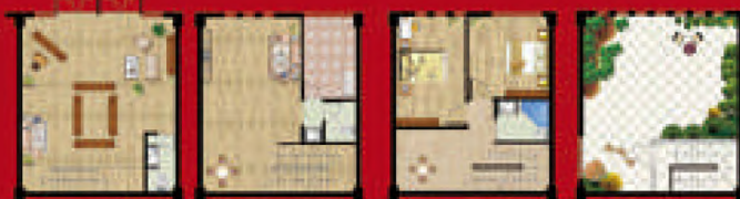
大富之家/翡翠高墅 建筑面积约153㎡

vip: 5150866/5150865 中国珠宝首饰行业面向全球招商, 独栋商铺VIP卡全城热销中!