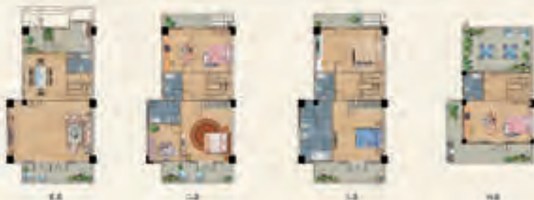
御璟别院 建筑面积约250㎡

项目围绕云南传统建筑与中国传统园林文化结合,以翡翠翡翠、御璟别院、璧景洋房、嶺玉洋房、玲珑公寓系列建筑,富有中国之传统,注重自然,融汇现代人居新观念,以生态健康居住理念,为业主提供高品质生活体验,物超所值的居住选择,24小时空气自然清新,鸟语花香。