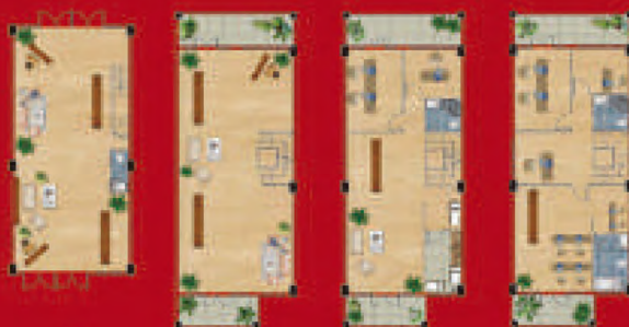
大富之家/翡翠高墅 建筑面积约452㎡