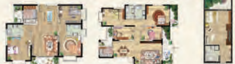
璧景洋房 一梯三户建面约140㎡ 三室两厅两卫