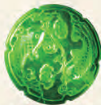
玲珑公寓 建面约40-50㎡ 一室一卫一客厅