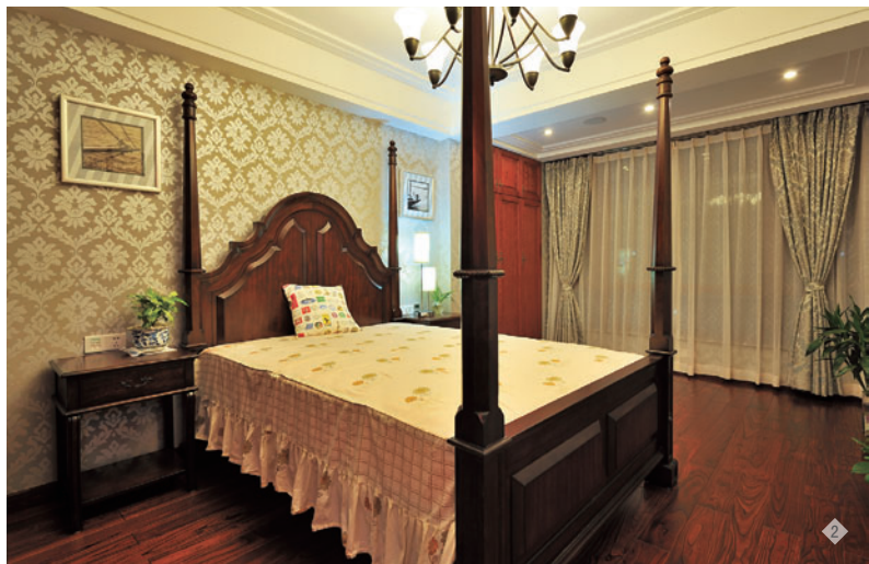
Designer | 1: 成都业之峰 2: 宁波业之峰 3: 黄楠