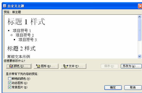
图 1.1.4 “自定义主题”对话框