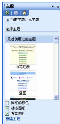
图 1.1.3 “主题”任务窗格

为了使用户更加方便地美化网页，FrontPage 提供了许多主题供用户选择，每个主题都独具特色。用户只要在如图 1.1.3 所示的 主题 任务窗格中选择一个主题，即可看到相应的丰富多彩的页面。另外，如果 FrontPage 中没有用户满意的主题，可在 主题 任务窗格中单击 新建主题... 超链接，在弹出的如图 1.1.4 所示的 自定义主题 对话框中自定义主题。