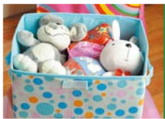
● 布艺收纳箱收纳毛绒玩具。