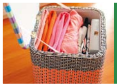
● 藤草编织箱可以收纳衣物。