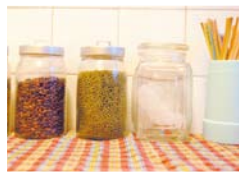
● 玻璃罐在厨房的应用。