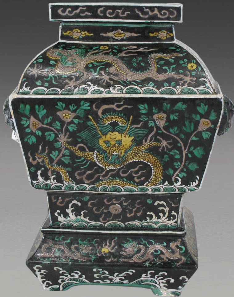
香炉 明万历年间 瓷 27.9cm×17.8 cm