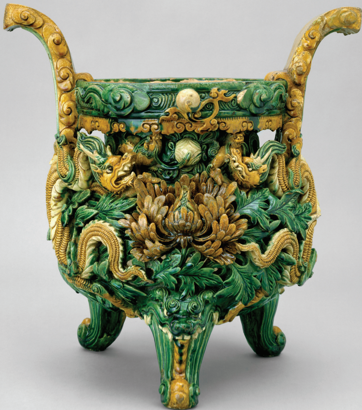
香炉 明 彩色釉料 43.5cm × 33 cm