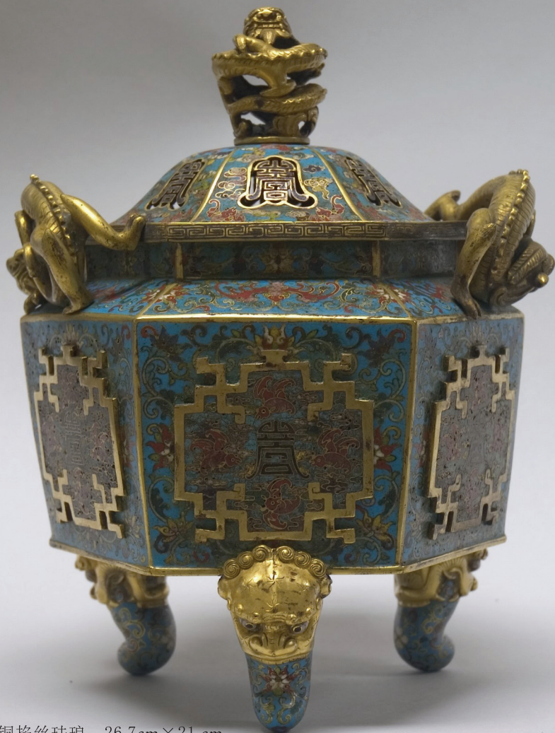
香炉 清康熙年间 铜掐丝珐琅 26.7cm×21 cm

本书主要介绍了香文化的发展，香文化与宗教的联系，还有香器的发展历程、用途和工艺鉴赏，希望通过阅读本书，能够为读者了解香器、赏玩香器、收藏香器带来帮助。