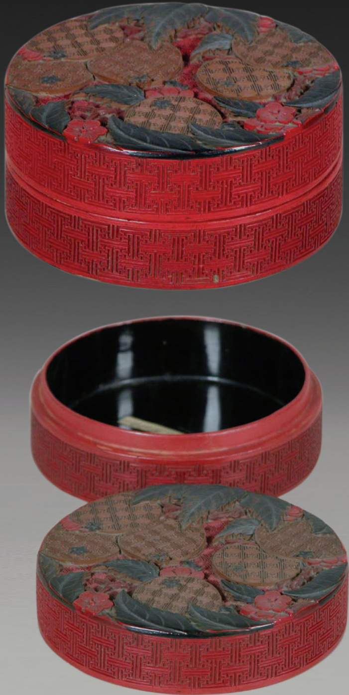
香盒 清乾隆时期 木漆 4.4cm×9.5 cm