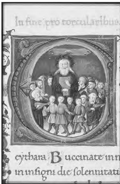
图1-3 中世纪儿童形象

很多哲学家和教育家对此提出反对，他们不约而同地发表了关于儿童教育的重要论述，谴责使用恐吓和暴力对待儿童，并提出应给予孩子尊重，讲求