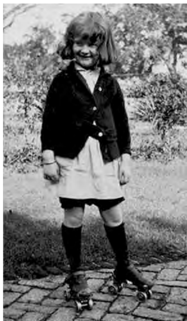
图1-8 1921年女童服装照片