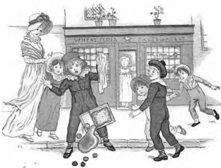
图1-6 18世纪末男童服装“skeleton suit”和女童高腰裙