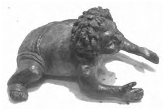
图1-1 穿尿布的古希腊婴儿雕像

非常宽而长的长方形布料，在身体的两侧缝纫起来，肩部用针别起或缝纫，腰部束住。在天气热的时候，婴儿通常什么也不穿，或者如图1-1所示，只穿尿布；天气冷的时候，大人用毛毯包裹住他们。大一些的儿童，用一块布围住腰至臀部，像短裤一样。再大一些的少年像大人一样穿希顿。