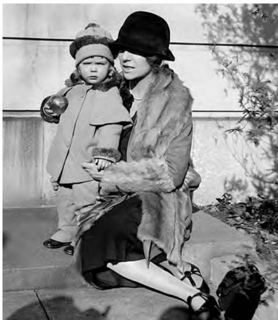
图1-9 1927年女童服装照片