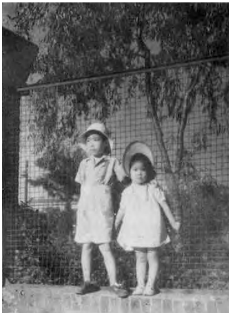
图1-11 民国儿童服装照片