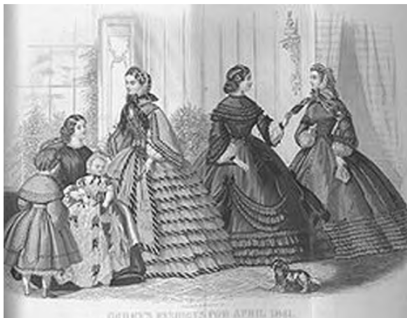
图1-7 1861年女童服装厚重又紧束身体

在1820年左右，成人的时装款式又回到了童装上，这是在工业革命中产生的新兴中产阶级通过儿童衣着炫耀财富和展示社会地位的结果。维多利亚风格使女童裙子重新穿上裙撑、多层衬裙和臀垫，男童和女童都穿上胸衣。大一些的少年穿短上衣、短裤、长裤和其他样式的军队风格的制服，虽然有一些也比较舒适，但这不再是童装追求的目标。孩子们穿着精致的衣服，戴帽子，穿高跟窄鞋，衣服面料厚重、暗沉，一直到19世纪末（图1-7）。