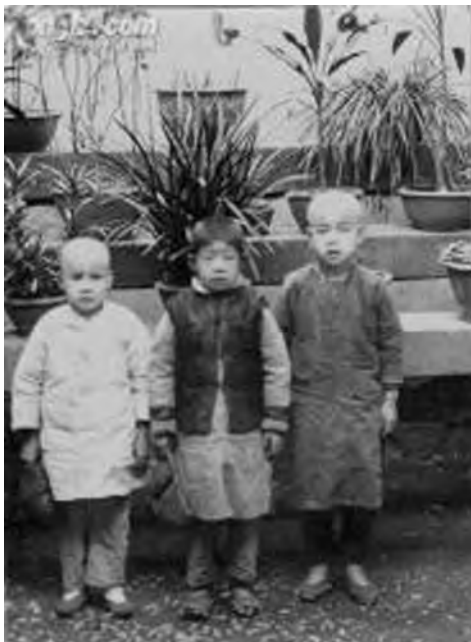
图1-10 清末男童服装照片