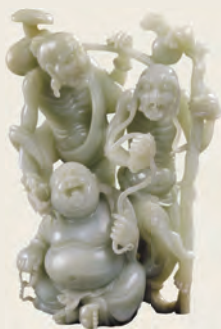
和田青白玉三宝佛

一种，其颜色由淡青到深青，颜色种类较多，有虾青、竹叶青、杨柳青、碧青、灰青、青黄等，一般以深青、竹叶青最为普遍。