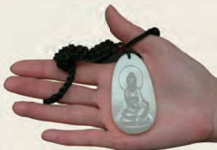
和田玉籽料观音牌

和田玉籽料在河床中经过千百万年的冲刷和磨砺，自然受沁，它会在质地松软的地方沁上颜色，在有裂隙的地方深入肌理。这种皮色是很自然的，叫作活皮。颜色应是由深变浅，裂隙上的颜色则由浅至深。并且呈现褐色的松花状、水草状的颜色沁入。