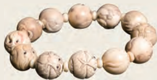
象牙十二生肖手串

审美功能，而是更加强调其保健功能。这不仅反映了人们的现实需求，同时也反映了整个社会的日益理性化趋势。