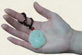
枣红皮籽玉佛（寓“鸿运当头”之意）

由于和田玉籽料的皮色是在原砾石表面缓慢形成的，是由风化、水解作用以及大气循环等因素共同形成的，是分阶段的。因此，沁入和田玉内的颜色由深入浅，具有层次感，