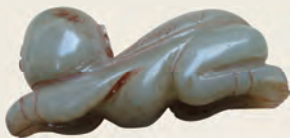
清·和田青玉童子蝉