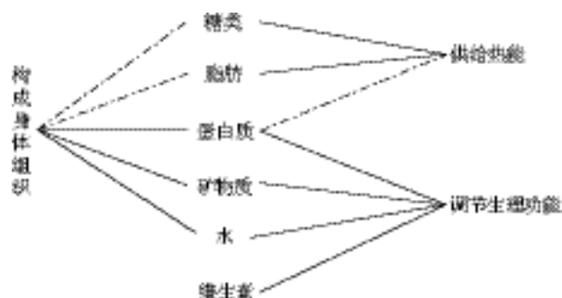
图 1-2 营养素类别及其生理功能

人们对于食物有其共同的也是最基本的营养要求, 即供给能量、维持体温, 并满足生理活动和从事生活劳动的需要; 构成细胞组织、供给生长发育和自我更新所需要的材料, 并为制造体液、激素、免疫抗体等创造条件; 保护器官机能、调节代谢反应, 使机体各部分工作能协调地正常运行。营养素类别及其生理功能见图 1-2。