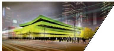
世宗社区活动中心 SOCIAL COMMUNITY CENTER