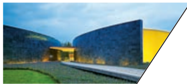
集美社区艺术中心 JIMEI COMMUNITY ART CENTER