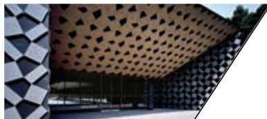
金山社区活动中心 KANAYAMA COMMUNITY CENTER