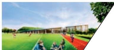
普尔森社区活动中心 PULSEN COMMUNITY CENTER