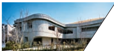
唐木田社区活动中心 KARAKIDA COMMUNITY CENTER