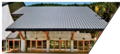
格伦伊格尔斯社区活动中心 GLENEAGLES COMMUNITY CENTER