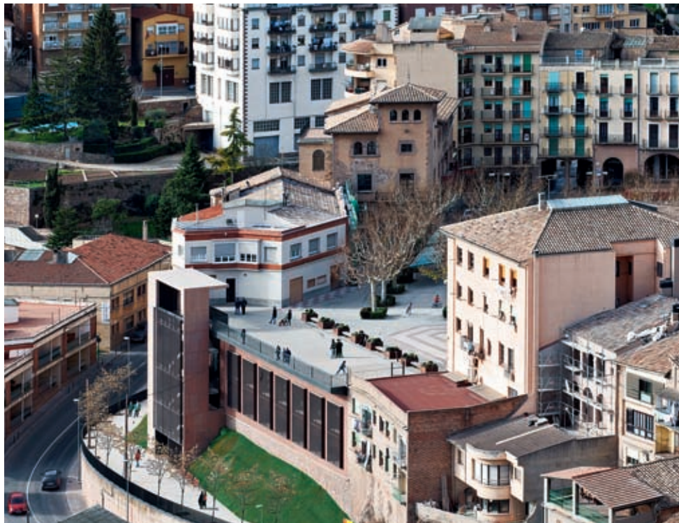
图2-2 卡多纳社区活动中心