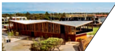
KEAST 社区公园展览馆 KEAST PARK COMMUNITY PAVILION