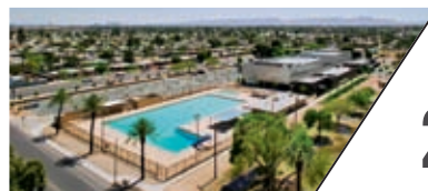
MARYVALE社区中心 MARYVALE COMMUNITY CENTER