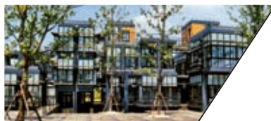
康居社区活动中心 KANGJU COMMUNITY CENTER