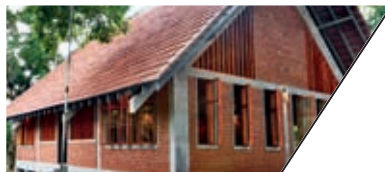
IFRC社区活动中心 IFRC COMMUNITY CENTER