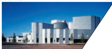
卡达莱文化中心 YURIHONJO CITY CULTURAL CENTER, KADARE