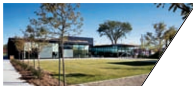
PIERREFONDS 社区活动中心 PIERREFONDS COMMUNITY CENTER