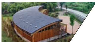
毕马威安康社区中心 KPMG-CCTF COMMUNITY CENTER