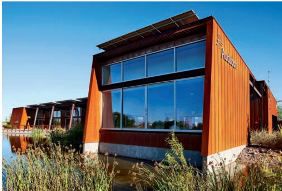
图2-1 里约萨拉多奥杜邦中心

对环境的再次破坏，以及对历史文化的继承和保留。西班牙巴塞罗那的卡多纳社区活动中心就是由旧建筑改造扩建而来的，设计者在尊重原有建筑结构的基础上，仅对建筑表面和内部进行了修整。在建筑的前方加盖了一座既有楼梯又有电梯的直角形建筑。新的垂直建筑在连接核心的同时，又解决了进入每层楼的交通问题。新旧体块有机地结合在一起，形成绝妙的新旧对比，建筑因此极具特色并为当地带来了生机与活力（图2-2）。