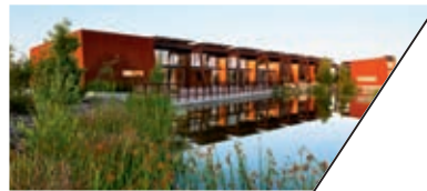
里约萨拉多奥杜邦中心 RIO SALADO AUDUBON CENTER