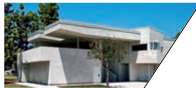
雷吉·罗德里格斯社区活动中心 REGGIE RODRIQUEZ COMMUNITY CENTER