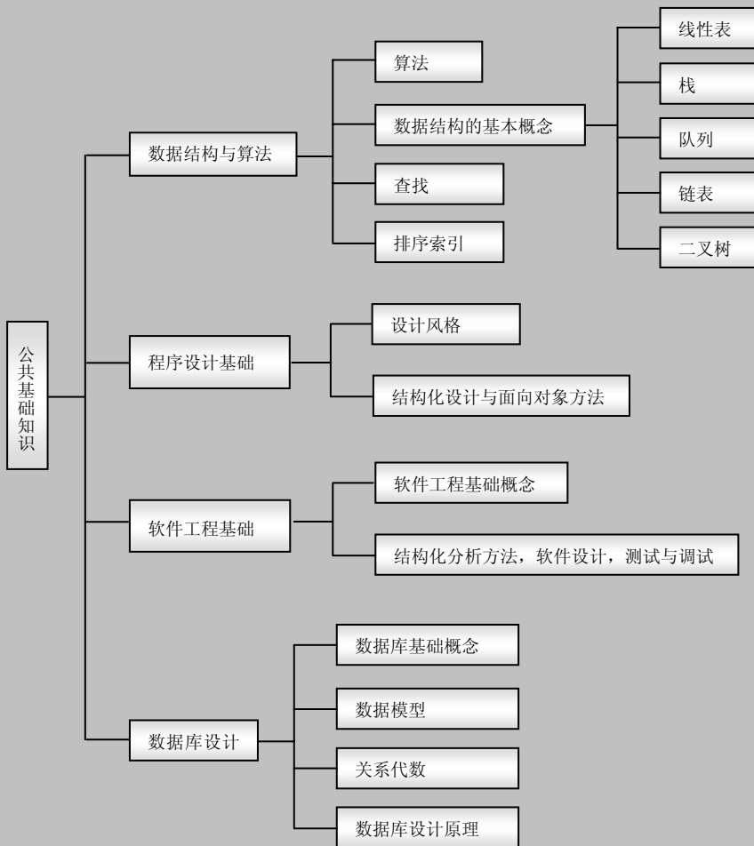
本章知识的逻辑结构图