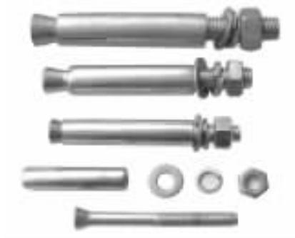
图 1-8 金属膨胀螺栓（普通型）