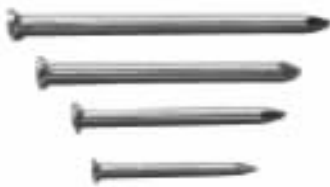
图 1-2 水泥钢钉

水泥钢钉 (图 1-2) 亦称特种钢钉、高强水泥钢钉、镀锌水泥钉。钉杆较粗, 材料为优质中碳钢, 具有较高的硬度、强度和韧性。可用手工锤将其打入混凝土、水泥砂浆层、坚实的砖和砌块砌体及薄钢板, 用以固定工程中使用的附件、连接件或轻钢龙骨等。水泥钢钉的常用规格见表 1-2。