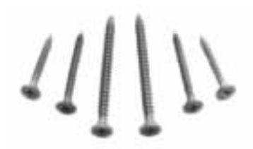
图 1-5 墙板自攻螺钉

墙板自攻螺钉（图 1-5）是一种主要适用于在轻钢龙骨上固定纸面石膏板等板材的一种专用自攻螺钉。墙板自攻螺钉的材质比普通自攻螺钉好，螺钉头形式常用的是十字沉头式，但其钉头与钉杆交接处呈曲线状。采用墙板自攻螺钉在轻钢龙骨上固定纸面石膏板，不需要