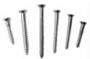
图 1-3 木螺钉（沉头）

木螺钉（图 1-3）亦称木螺丝。按钉头的形式分为沉头（平头）、圆头、半沉头（圆平头）、半圆头（平圆头）等数种。钉头开槽有一字槽和十字槽，此外尚有六角头等。其中以沉头木螺钉应用最为广泛。木螺钉的材质，除了常用的铁质外，还有铜质、不锈钢质和表面镀锌等品种。