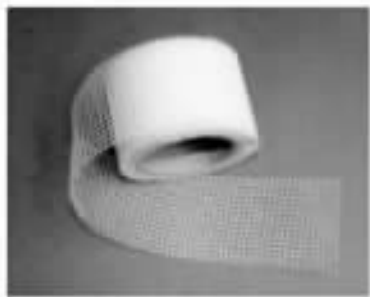
图 1-13 玻璃纤维接缝带

是玻璃纤维为基本材料，经表面处理而成的轻质隔墙接缝材料。它具有横向抗张强度高，化学稳定性好、吸湿性小、尺寸稳定、不燃烧等特性，并易于粘接操作。玻璃纤维接缝带见图 1-13。玻璃纤维接缝带的规格和技术性能见表 1-9。