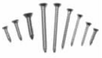
图 1-4 自攻螺钉（沉头）

自攻螺钉（见图 1-4）亦称自攻螺丝、快牙螺丝，为钢制，经表面镀锌钝化的快装紧固件。按其钉头开槽形式分，有十字槽、一字槽两种。按螺钉头的形状，分别有沉头（平头）、半圆头（平圆头）、半沉头（圆平头）、盘头（平圆头）和六角形等。