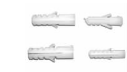
图 1-7 普通塑料膨胀螺栓

塑料膨胀螺栓通常使用于受力不大的固结施工，或是用于潮湿、有腐蚀性气体等介质的环境。塑料膨胀螺栓在使用时，先在基体上用冲击钻或电锤钻出相应直径和深度的孔，把胀管塞入孔中，然后将木螺钉、自攻螺钉或专用螺钉穿过被固定件的通孔，旋入或敲入胀管内紧固。普通塑料膨胀螺栓 (图 1-7) 的常用规格及应用技术参数见表 1-6。