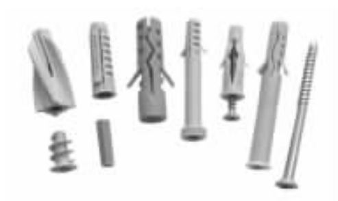
图 1-6 塑料膨胀螺栓

塑料膨胀螺栓 (图 1-6) 亦称塑料胀铆螺栓、塑料胀管等。材质一般为聚乙烯或聚丙烯等，其外形有多种样式并具有不同的使用性能，可以分为普通型、通用型、万能型、锤击型、加气混凝土专用型等若干种类，其中普通型的应用最广泛。