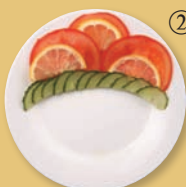
①花开富贵 ②阳光三叠 ③绿杨烟外