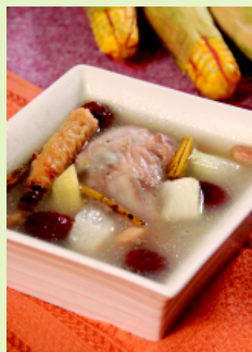
冬笋鱿鱼汤 ..... 99 牛蓉蒲公英羹 ..... 99