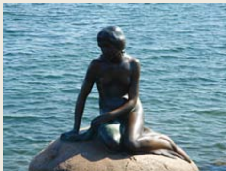
丹麦的美人鱼铜像