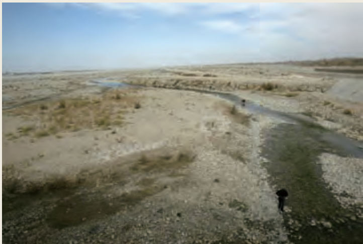
传统的在河床里摸玉的方式，对白玉河的生态环境不会造成太大的影响

和田玉的开采一般有两种方式：一种是开采山料，称“攻玉”，就是在昆仑山上有原生玉矿的成矿地带，每年5月至8月天气转暖时，采玉人登昆仑雪山之巅掘坑取玉。另一种是在河流上、下游拣玉或挖玉。玉龙喀什河上游有条支流叫汉尼拉克河，它的尽头是现代冰川，称阿格居改。阿格居改的雪山处在玉矿的断裂带上，这里的冰川年复一年地侵蚀着玉矿带，将玉料挟带到河谷中。由于冰川搬运作用而形成的块状玉料，既不像山料那样棱角分明，也不像籽料那样圆滑鲜润，而是介于两者之间，称“山流水”。