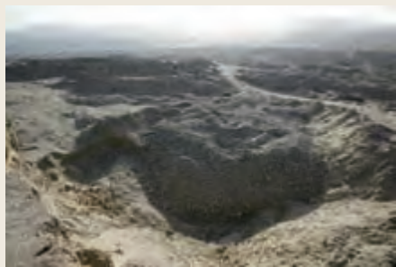
机械化的开挖方式一度将玉龙喀什河两岸破坏得面目全非

和田玉的开采一般有两种方式：一种是开采山料，称“攻玉”，就是在昆仑山上有原生玉矿的成矿地带，每年5月至8月天气转暖时，采玉人登昆仑雪山之巅掘坑取玉。另一种是在河流上、下游拣玉或挖玉。玉龙喀什河上游有条支流叫汉尼拉克河，它的尽头是现代冰川，称阿格居改。阿格居改的雪山处在玉矿的断裂带上，这里的冰川年复一年地侵蚀着玉矿带，将玉料挟带到河谷中。由于冰川搬运作用而形成的块状玉料，既不像山料那样棱角分明，也不像籽料那样圆滑鲜润，而是介于两者之间，称“山流水”。